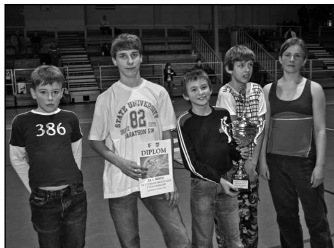
▲ Vítězné družstvo Albrechtic s putovním pohárem.

Školní kroužek má tréninkové dny ve čtvrtek od 14,30 hod. v tělocvičně ZŠ Albrechtice.