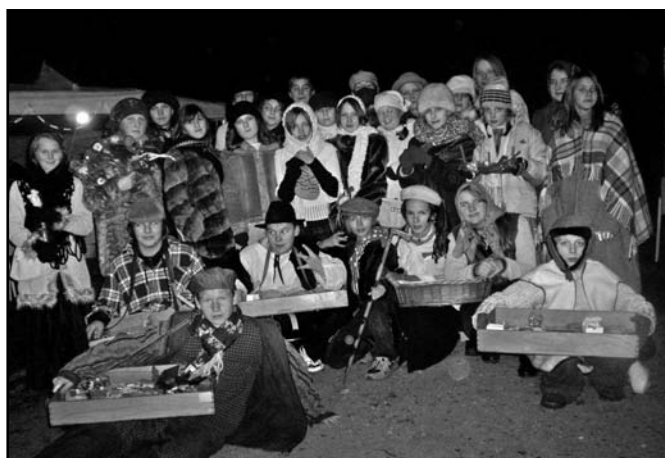
▲ Čtyřicet prodejců se opravdu činilo. Část výtěžku věnujeme na charitativní účely.