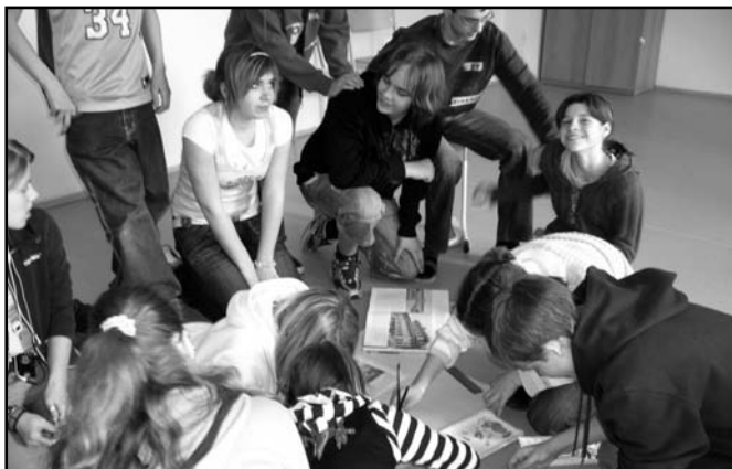
▲ Žáci 8.B.