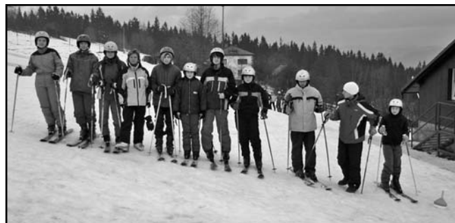
▲ 2. družstvo.