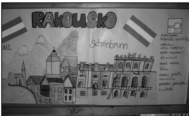
▲ Rakousko - prezentace 8.B.