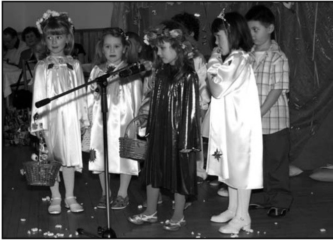
▲ Szkoła i przedszkole, Balik 2008.

Zabawy i bale od dawien dawna były częścią składową śląskich obyczajów. My również kroczymy śladami naszych przodków i przy współpracy z Macierzą Szkolną urządziliśmy pod koniec stycznia dla naszych dzieci słynny bal przebierańców. Popatrzmy więc na to popołudnie nie okiem dorosłego lecz okiem tych, którzy byli uczestnikami tej wspaniałej zabawy, która w tym roku wirowała pod tytułem „Uśmiech Olbrachcic”.