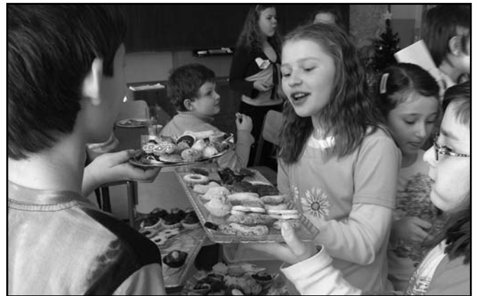
▲ Konkurs Złota Bombka - tradycje w naszych domach.

- I co z tego? Ale u nas są wszyscy sędziowie!!! – mówi Lucyfer