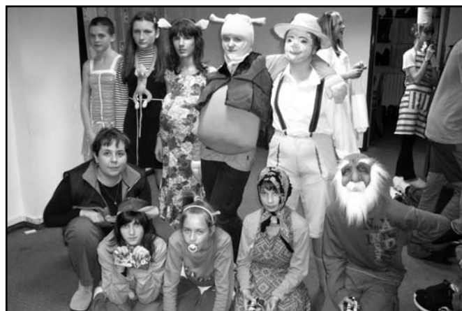
▲ Žáci 7.B na karnevalu.