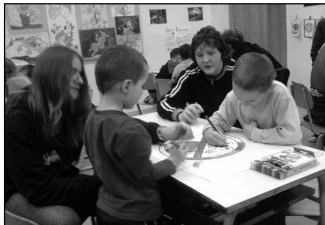
▲ Žáci 9.A společně s předškoláky.