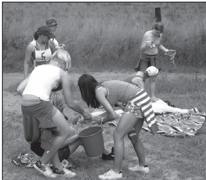
▲ Stanoviště srážka kola

Krajské kolo v Opavě 24.5.2008 toto družstvo rovněž vyhrálo. Své znalosti a dovednosti předvedlo na stanovištích: autonehoda s pneumotoraxem, požár v budově školy s popáleninami a rvačka fanoušků s tepenným krvácením a nožem v břichu.