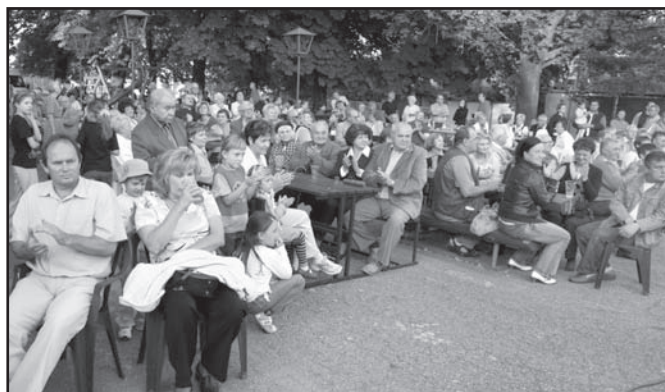
▲ Posluchači v parku