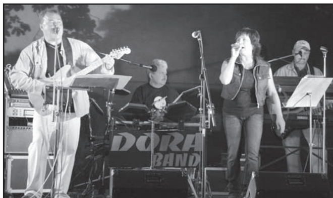
▲ Hudební skupina Doraband