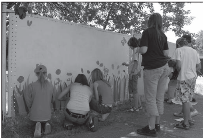
▲ Pátek – malování plotu na sídlišti