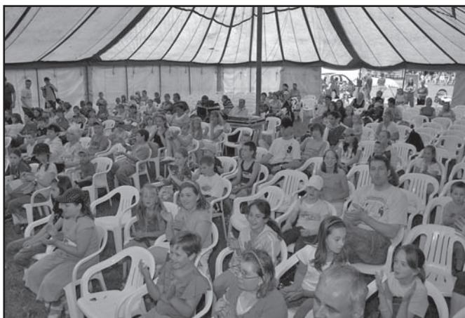
▲ Pátek – program pro děti