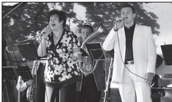
▲ Hudební skupina Náladička