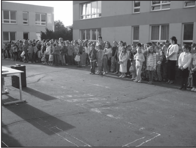
▲ Zahájení školního roku na nádvoří školy