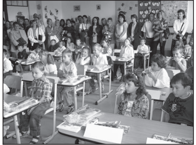
▲ Zahájení školního roku v 1. třídě