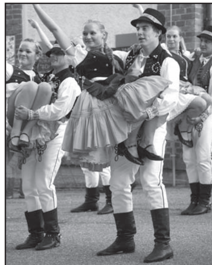
▲ Folklorní soubor Suszanie