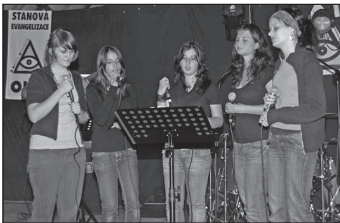
▲ Koncert finalistek Albrechtické STAR