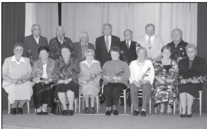
▲ Jubilanti 70 let.

Drodzy Jubilaci! Choć czas tak płynie, Jednak nie ginie iskra, co łączy Was. Wszak wspólna praca Młodość Wam wraca I nie złamie Was czas. Niechaj dobre zdrowie służy Wam Jeszcze wiele lat, A serca biją w jednym rytmie Miłości i zgodzie.