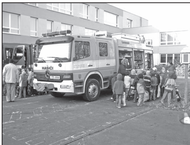
▲ Branný den.