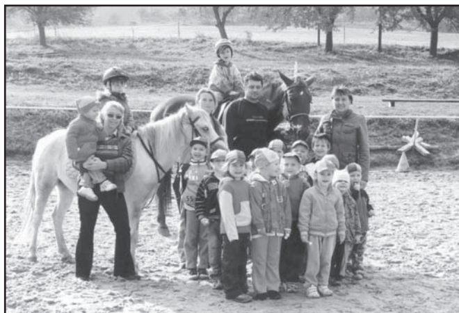
▲ Jízda na koních.

zajistit i blahodárný odpočinek po obědě, proto jsme vyměnili staré polštáře a připravujeme zakoupení nových příkrývek a matrací. Ještě letos budou mezi dětskými WC zhotoveny přepážky a vyměněny vadné záchodové mísy.