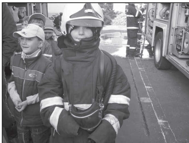
▲ Branný den.