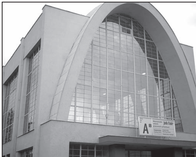
▲ Brněnské výstaviště.