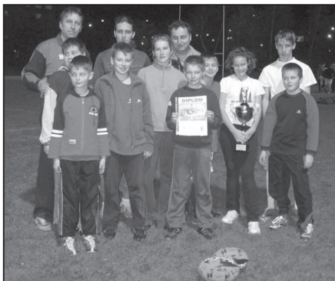
▲ Družstvo z Albrechtic s putovním pohárem a diplomem za 1. místo ve druhém turnaji.