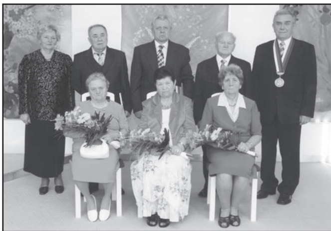
▲ Zlaté svatby.