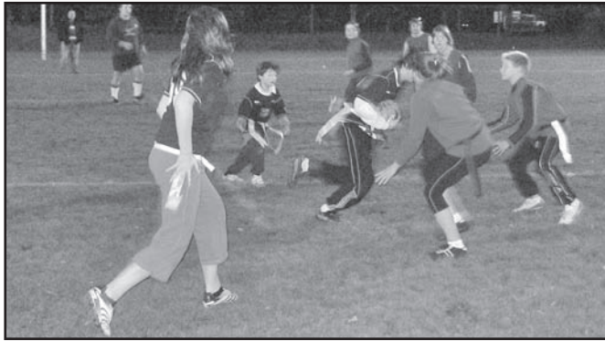
▲ Jak je vidět druhý i třetí turnaj se odehrál za umělého osvětlení.

Výsledky 2. turnaje : Gorkého - Albrechtice 2:4, Žákovská - Školní 4:3, Gorkého - Žákovská 4:3, Albrechtice - Školní 5:2, Žákovská - Albrechtice 1:5 a Školní - Gorkého 5:0