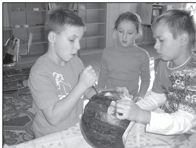
▲ „Kolory Jesieni” - projekt Olbrachcice i Stonawa