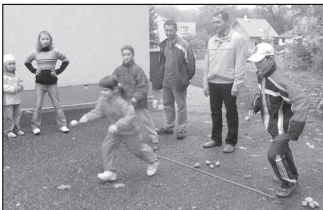
▲ „Święto Ziemniaka” razem z rodzinami.

Na początku roku szkolnego pojechaliśmy na ekskursję razem z uczniami z sąsiedniej polskiej szkoły w Stonawie do zamku w Karwinie. Bliższą współpracę ze stonawską szkołą nawiązaliśmy już podczas szkolnego obozu letniego, gdzie dzieci obydwu szkół miały okazję się zaprzyjaźnić i razem pobawić. Obóz był bardzo udany, dlatego nauczycielki z Olbrachcic i Stonawy postanowiły dalej rozwijać współpracę między obiema placówkami i wspólnie opracowały projekt pt. „Kolory Jesieni”. Tym razem dzieci olbrachcickie wyjeżdżały cały tydzień do Stonawy, gdzie z kolegami zasiadały do ławek szkolnych i razem się uczyły. Taka współpraca umożliwiła nauczycielom wykorzystać nieco inne metody nauczania oraz porównać wiadomości szkolne. Wszystkie zajęcia szkolne były prowadzone tak by dzieci mogły nabyte dotychczas wiadomości wykorzystać w praktyce, tzn.: konkursy, testy, zadania matematyczne, język polski, angielski i czeski a wszystko łączące nauki o środowisku czy historia naszej okolicy ukoronowane były własnymi pracami plastycznymi.