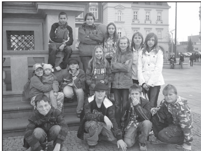
▲ Před Ostravským muzeem.