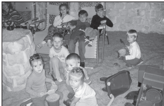
▲ Hrátky v solné jeskyni.

Myslíme, že ano, když byly před tolika lety, budou i za 25 let.