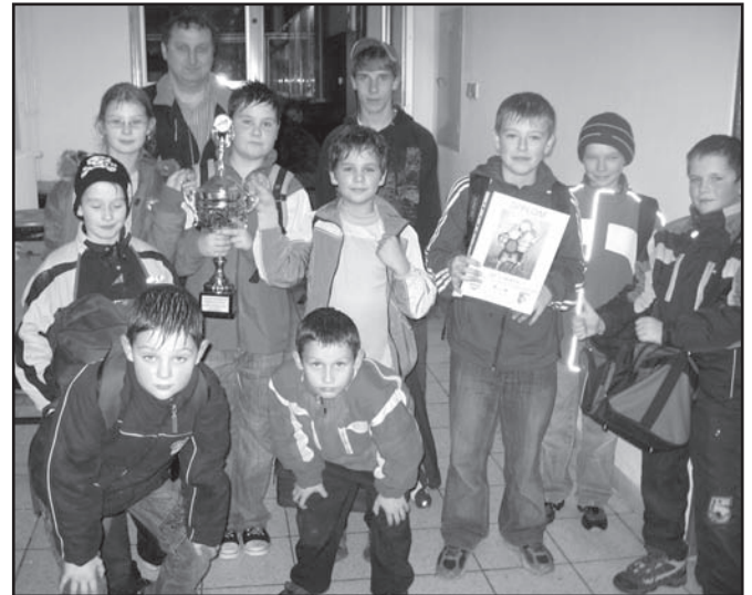
▲ Družstvo Albrechtic po třetím turnaji s vítěznou trofejí.

Asi poslední turnaj v tomto roce a první v tělocvičně se uskuteční 5. prosince v Městské sportovní hale v Havířově. Turnaje budou pokračovat až do května příštího roku a dva neúspěšnější družstva postoupí na celorepublikový turnaj, který se již tradičně koná v Praze.