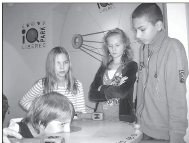
▲ Hry a klamy - výstava v Ostravě.