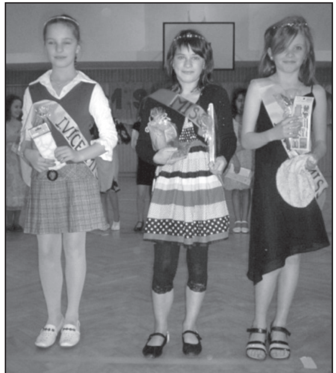
▲ 3. nejkrásnější dívky