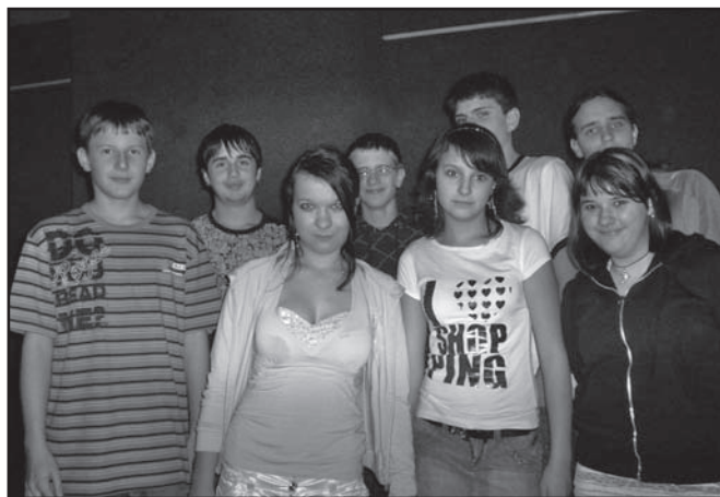
▲ Recitační sbor z 9.A – Vilém, tichý mech slavík, hrdliččin hlas, borový háj a vypravěč