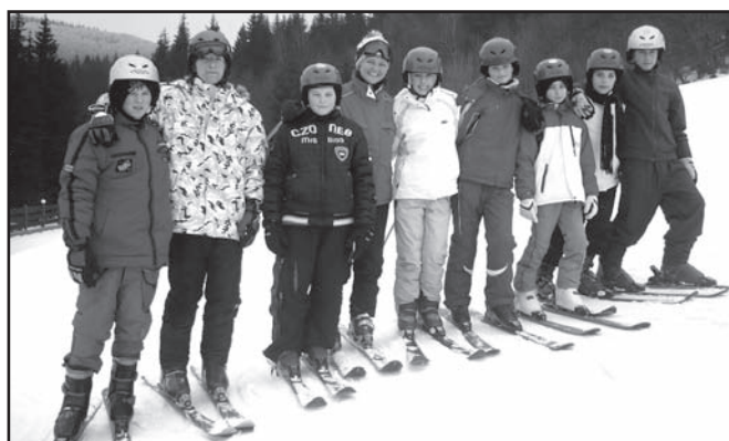
▲ 2. družstvo