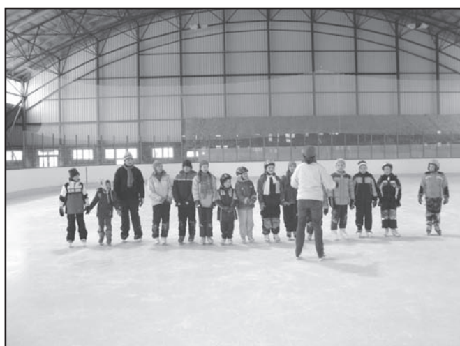
▲ Nasza grupa łyżwiarzy.