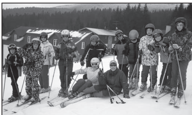
▲ 1. družstvo