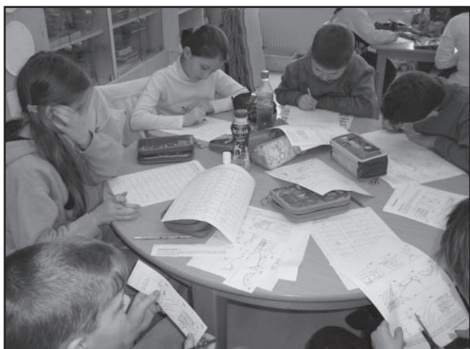
▲ Język czeski i matematyka.