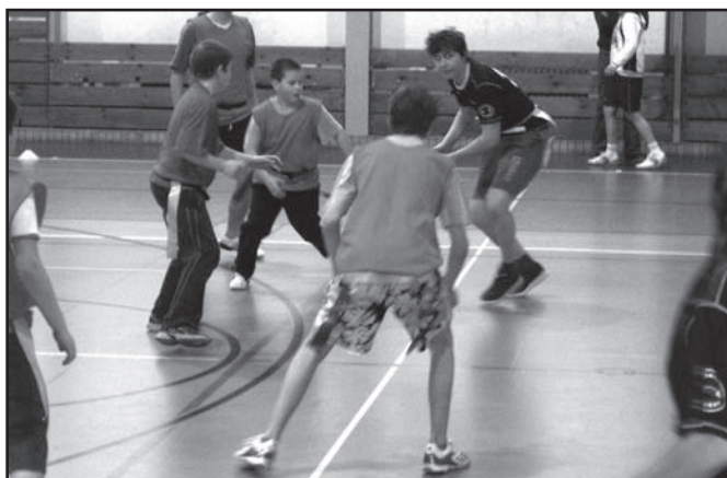
▲ Gorkého proti Albrechticím.

Družstvo ZŠ Gorkého přijelo na turnaj tentokrát v pozměněné sestavě, a i když bylo vyrovnaným soupeřem pro ostatní družstva, neodneslo si ani jediný vítězství a skončilo až na 4. místě.