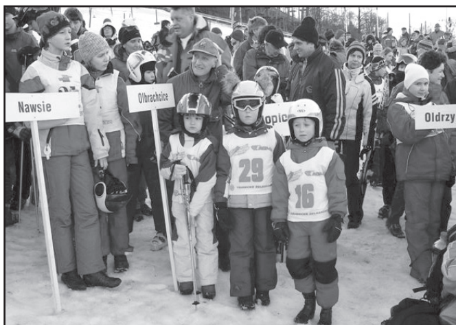
▲ Zjazd Gwiazdzisty.