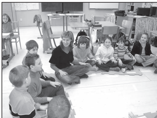
▲ Język angielski.