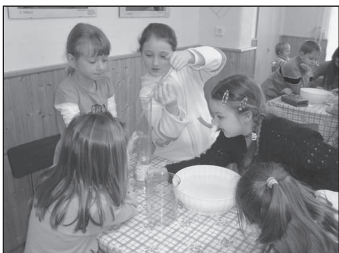
▲ Doświadczenia naukowe.