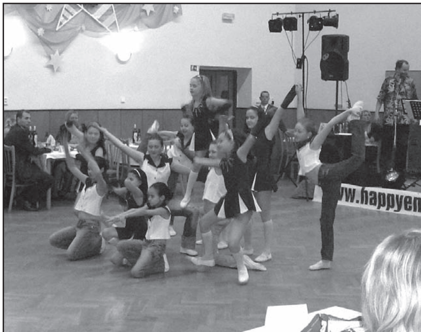
▲ Mažoretky Včelky.