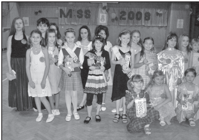
▲ Všechny soutěžící