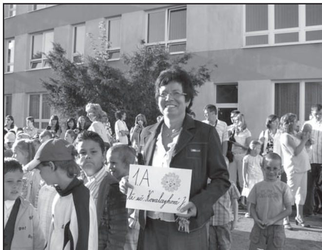
▲ 1. září 2009.

V letošním školním roce bude školu navštěvovat celkem 266 žáků, z toho 28 prvňáčků. Všem žákům přejeme v novém školním roce mnoho úspěchů při získávání znalostí a dovedností.