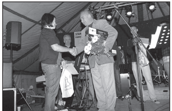
▲ Gratulace vítězce.