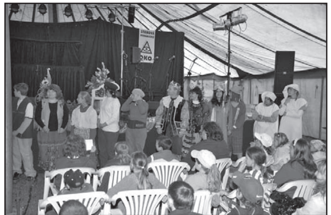
▲ Postavičky z večerníčků.