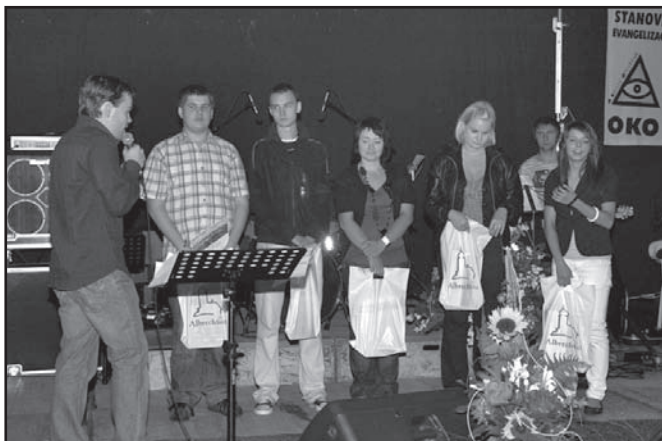
▲ Finálová pětka.