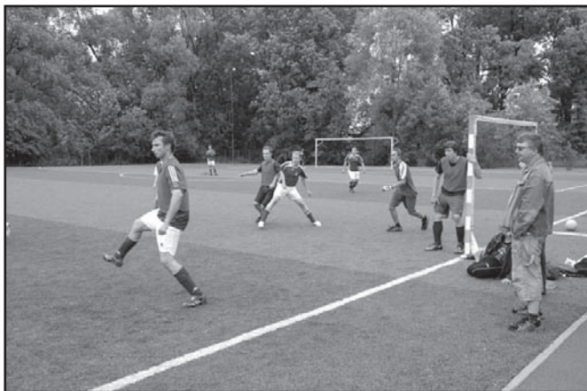
▲ Sportovní klání.