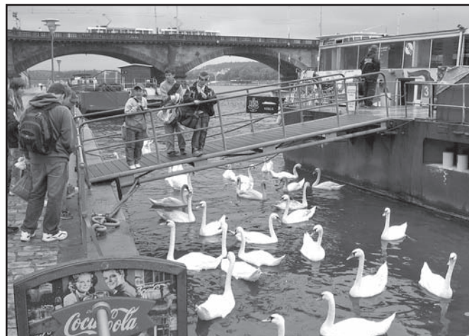
▲ Před jízdou lodí Visla do ZOO.

Souběžně s Finále Školní ligy ragby 2008 – 2009 probíhal i turnaj O titul Tatra Cup v kategoriích benjamin (vítěz ZŠ Vybíralova) a junior (vítěz ZŠ Plzeňská I).