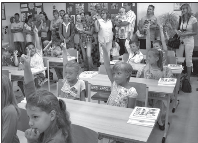
▲ 1. září 2009.