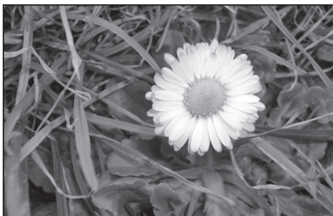
▲ Znaleźliśmy pierwszą stokrotkę.