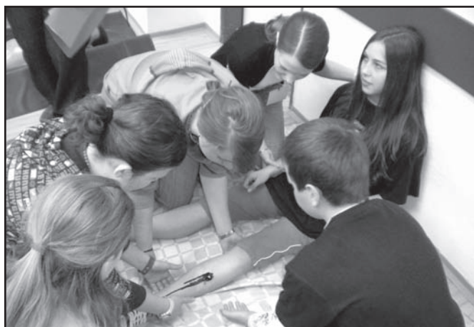
▲ HMZ - okresní kolo.