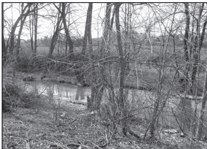
▲ Stonawka wiosną.