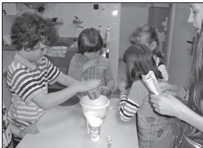
▲ Naszym kochanym mamusiom będzie na pewno smakowało.