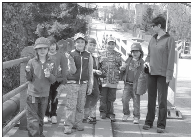
▲ W poszukiwaniu wiosny.