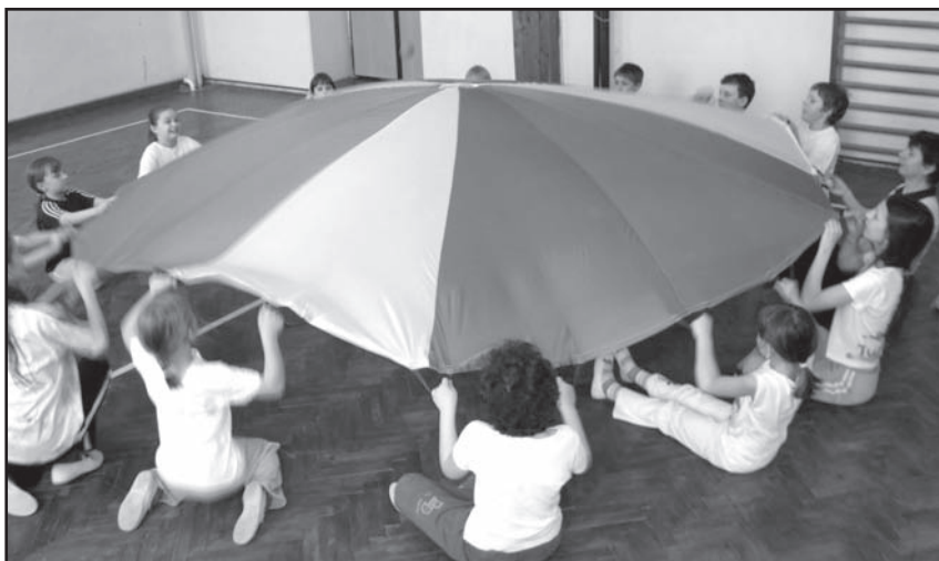
▲ Ćwiczenia ze spadochronem i piłeczką w Stonawie.