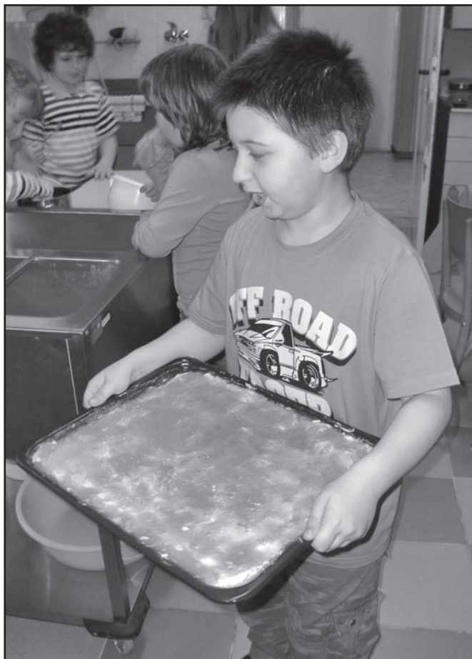
▲ Ciastko dla mam gotowe.