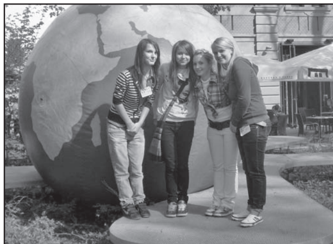
▲ GLOBE GAMES - tým.