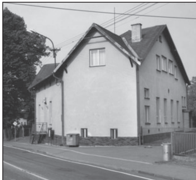
▲ Po rekonstrukcji, widok od strony północno-wschodniej.