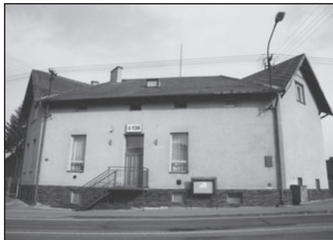
▲ Po rekonstrukcji, widok od strony wschodniej.