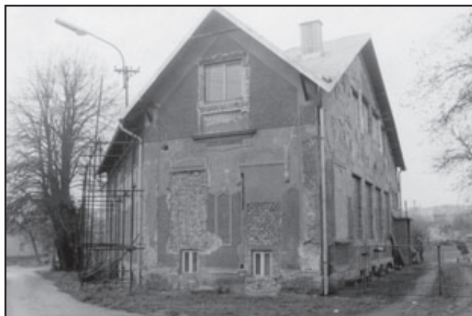
▲ Budynek w trakcie rekonstrukcji.