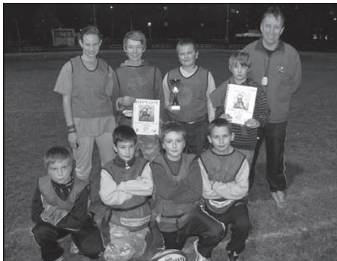
▲ Družstvo Albrechtic s pohárem za 2. místo.

Na druhý turnaj v kontaktním ragby jely Albrechtice do Olomouce, kde startovaly proti moravským týmům, na které ještě mladší hráči Albrechtic nestačili. Přesto se jim povedlo dvakrát proniknout do brankoviště soupeře, tentokrát to byli Patrik Chromik a Patrik Trnečka.