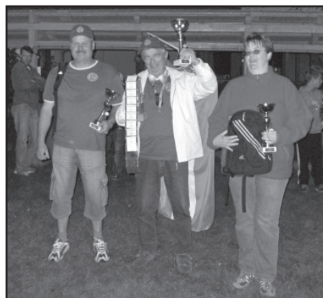
▲ Vítězné družstvo „ORLOVSKÝ KAHAN“.