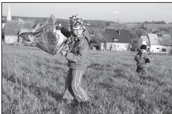
▲ Popołudnie z latawcami i naszymi rodzicami.