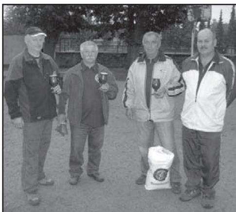
▲ Nejúspěšnější hráči r. 2010.