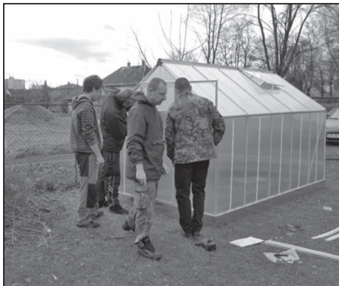
▲ Budowanie ciepłarni.