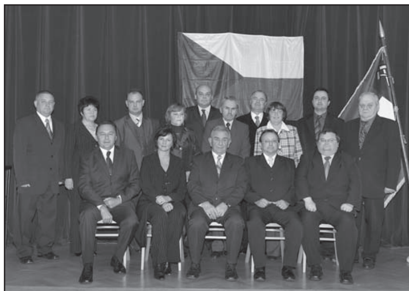
▲ Zastupitelstvo obce Albrechtice ve volebním období 2010 – 2014