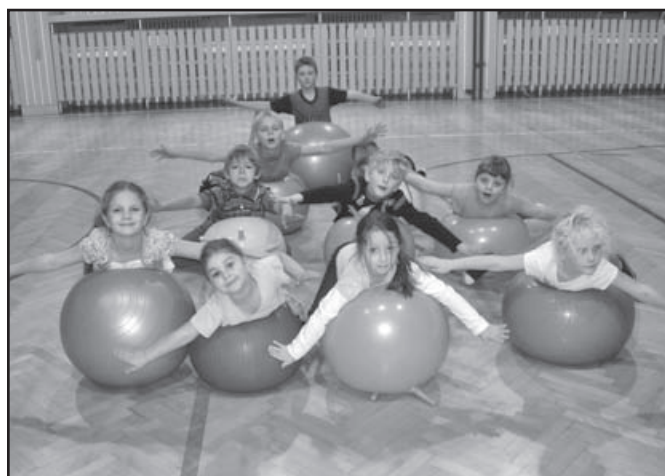
▲ Cvičení mladších žáků.