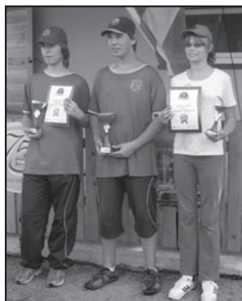
▲ Vítězi GRAND PRIX.