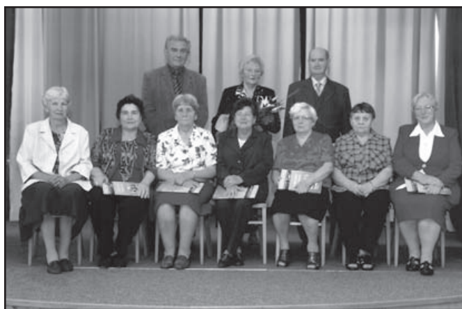
▲ Setkání občanů starších 70 let.