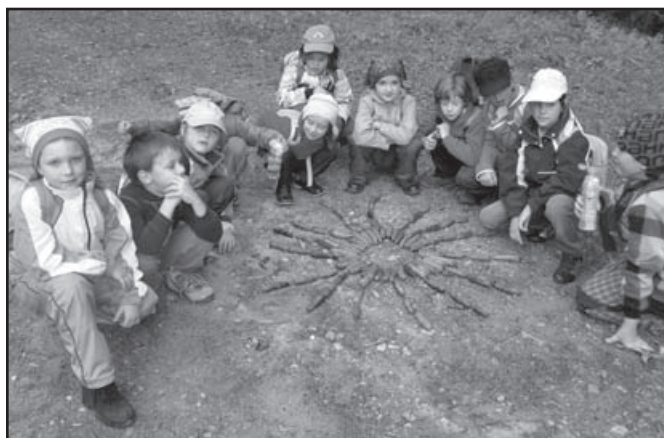
▲ Cały tydzień była wspaniała pogoda.

Uczniowie wraz z nauczycielkami spędzili wspaniały tydzień w pięknej łomniańskiej okolicy. Program ekologiczny pt.: Wyprawa za Drzewowym Dziadkiem, zaznajamiał uczniów z lasem i jego tajemnicami. Uczniowie zapoznali się z tym jak leśnicy poznają wiek, wysokość oraz obwód drzew, jakie rośliny i zwierzęta żyją w naszych lasach, dlaczego są niektóre lasy chronione i jak powinniśmy się zachowywać na terenach chronionych. Dlaczego warto segregować śmieci. Co się dzieje jak las choruje. Jak długa jest droga drewna z lasu do fabryki i do czego nam potrzebne jest drzewo a do czego drewno. Same wypróbowały jak robi się papier.