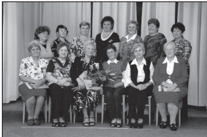
▲ Členky komise SPOZ.

Patnácti členná komise pracovala úspěšně celý rok. Na sedmi schůzích připravily členky komise akce pro děti, mládež a nejstarší občany. Nejvíce času věnovaly členky komise nejstarším občanům. Při příležitosti životních jubileí navštívily 65 občanů, kterým předaly blahopřání a dárkové balíčky. Během roku dvakrát navštívily naše občany v domovech důchodců v Karviné, Komorní Lhotce, Horní Suché a Českém Těšíně. Dům s pečovatelskou službou v Albrechticích navštěvují společně s členkami komise děti mateřské školy, základních škol a hudební školy.