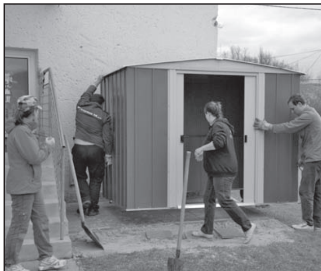
▲ Nasi rodzice przy budowie małego laboratorium ekologicznego.