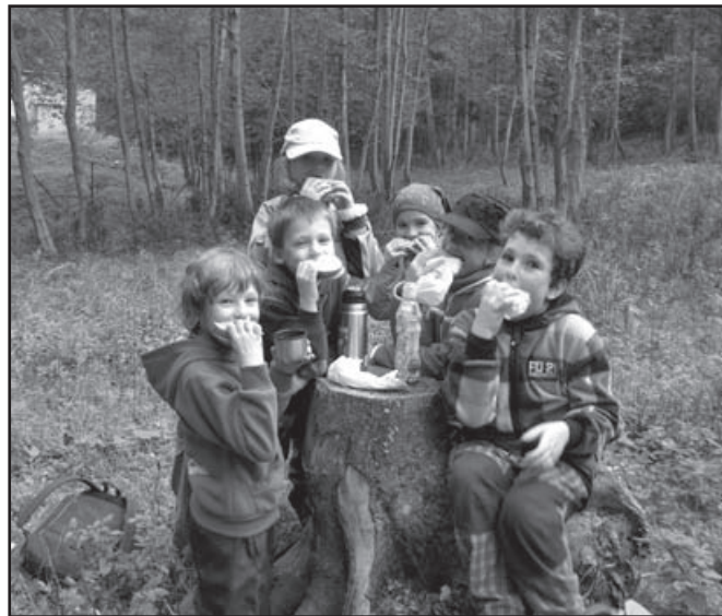
▲ Zielona Szkoła Łomna Górna.

Popołudnia uczniowie spędzali na zabawach i wycieczkach po okolicy, pisaniem listów, powtarzaniem nabytych wiadomości a wieczorami słuchali bajek i opowiadań czytanych przez panie. I chociaż czasami było tęskno do mamy i taty, to bogaty program zajęć pozwalał szybko zapomnieć na smutki. Czas szybko minął i dzieci z żalem stwierdziły, że już nadszedł czas powrotu do domu.