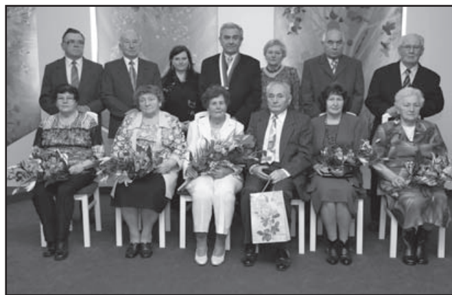
▲ Zlaté a diamantové svatby.

Letošní extrémní počasí, zejména dlouhotrvající deště v květnu a červnu se nepříznivě podepsalo na snůšce medu. Z prvních jarních květů, ovocných stromů včelky nepřinesly nic, v červnu byly medníky prázdné a včelaři uvažovali o dokrmování včel. Pak jsme spoléhali na medovicovou snůšku a lípu, ale přívalové deště důkladně spláchly i tyto naděje... Koncem července včelaři začali dokrmovat cukrem, aby včelstva vůbec přežila. Pro zimní období budou dávky cukru zvýšené nejmíň o 50% tj. na 16 kg cukru na včelstvo. Nepříznivou situaci včelařů