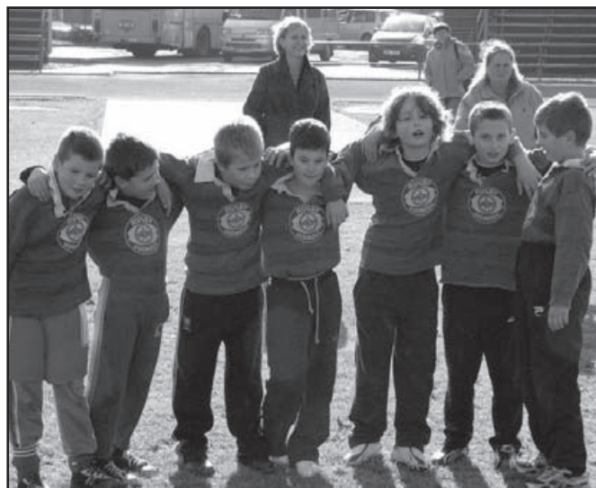
▲ Albrechtičtí kluci hráli v dresech, které jim zapůjčili Olomoučtí, ale příští rok už by měli hrát v dresech vlastních.