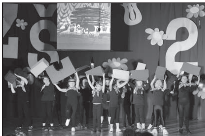
▲ Mravenečci z 1.B.