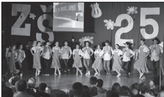
▲ Country tanec.