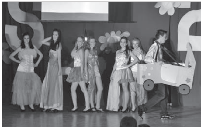
▲ Módní přehlídka.

Poděkování patří také všem sponzorům, bez kterých by uspořádání této akce bylo velice složité a obtížné: