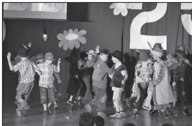
▲ Loupežníci z 2.A.