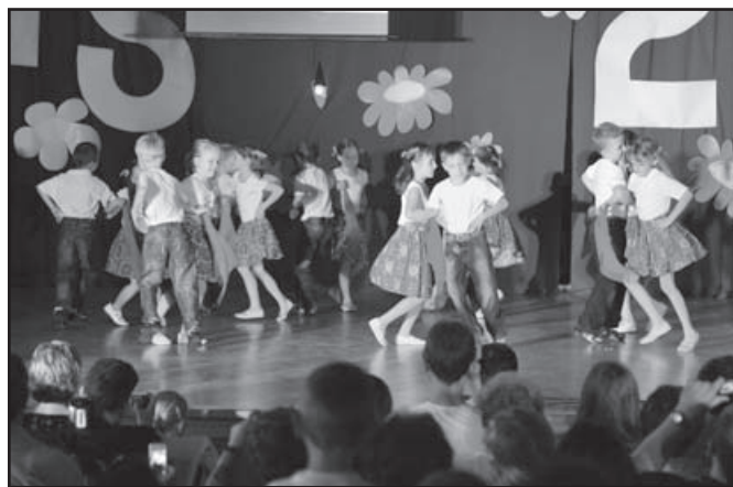
▲ Tanečníci z 1.A.