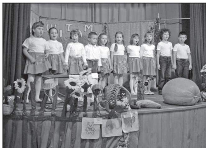
▲ Śpiewa „Drops”.