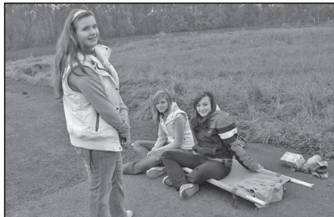
▲ Stanoviště s nosítky.