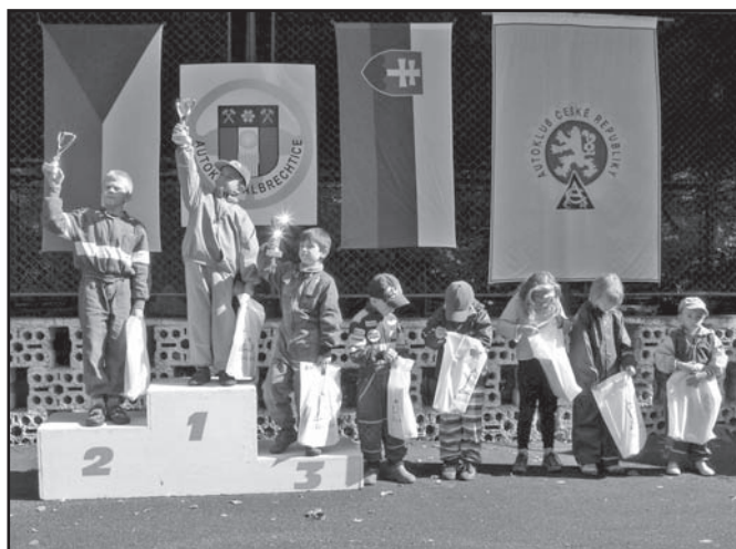
▲ Nejmladší účastníci Albrechtické míle 2009.