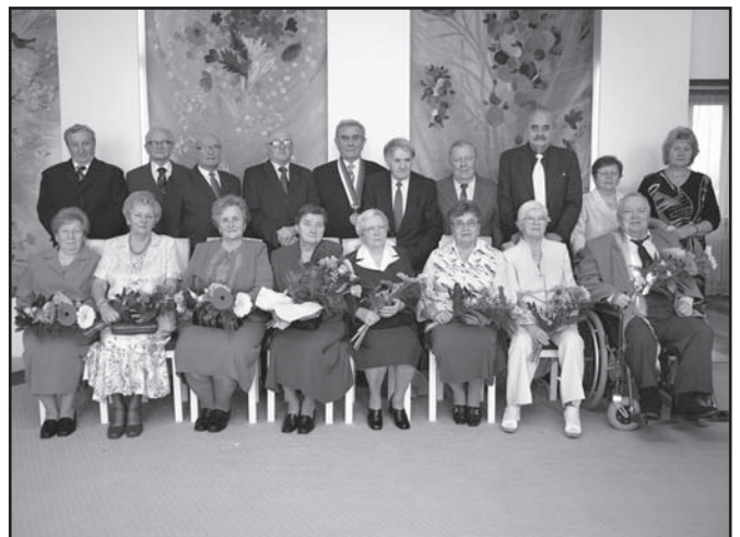
▲ Zlaté svatby.