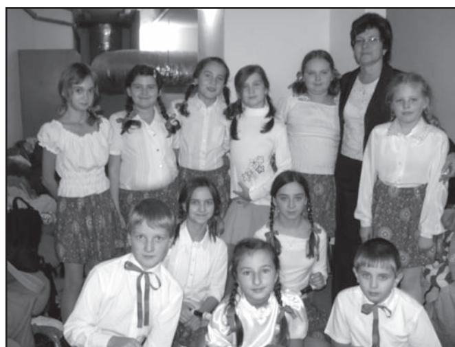
▲ Žáci vystupující v kulturním programu.