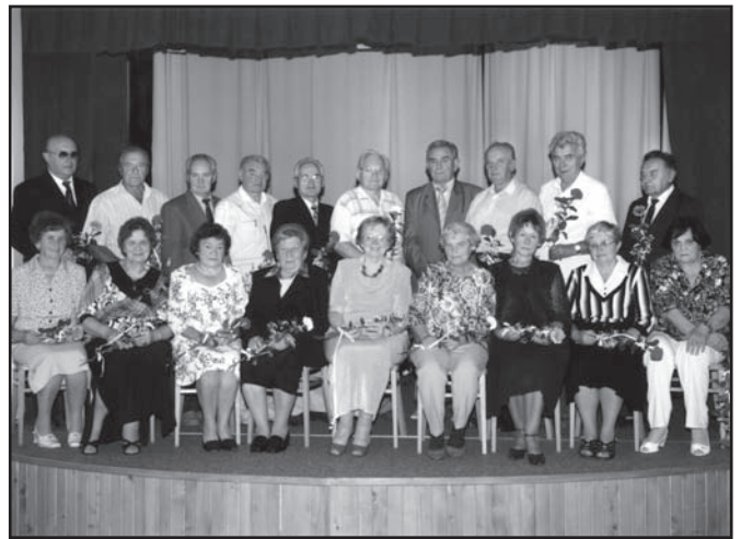
▲ Setkání občanů starších 70let.