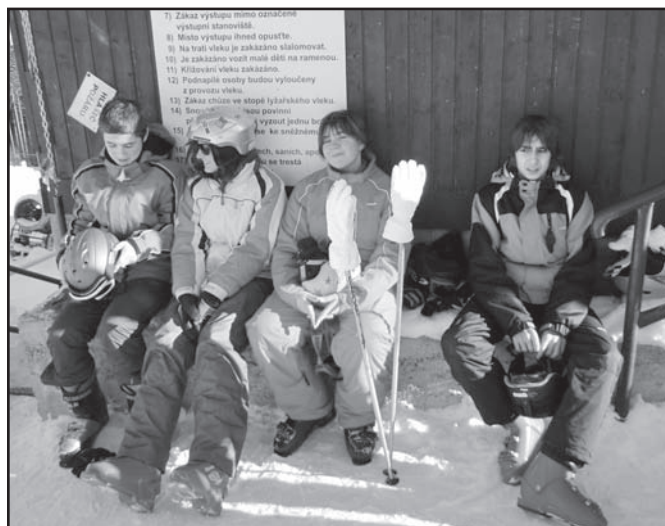
▲ Přestávka 1. družstva.