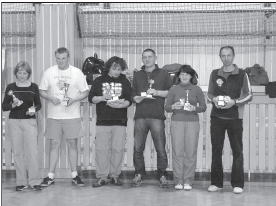
▲ Vítězná družstva.