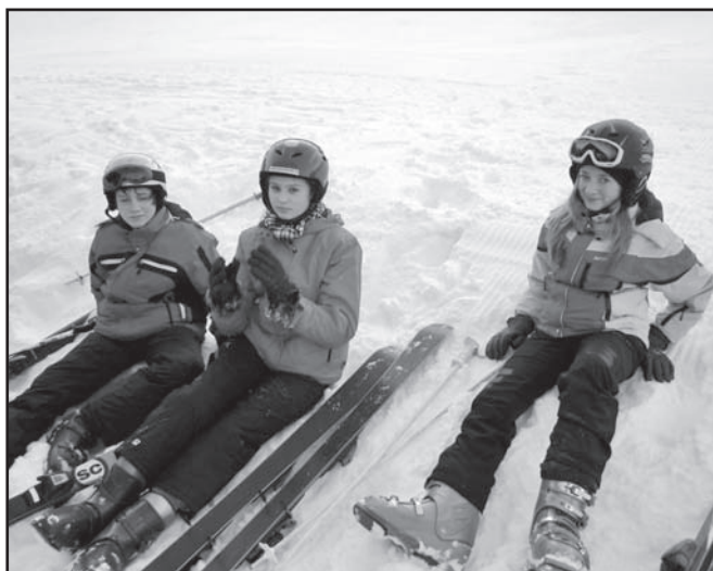
▲ Přestávka 2. družstva.