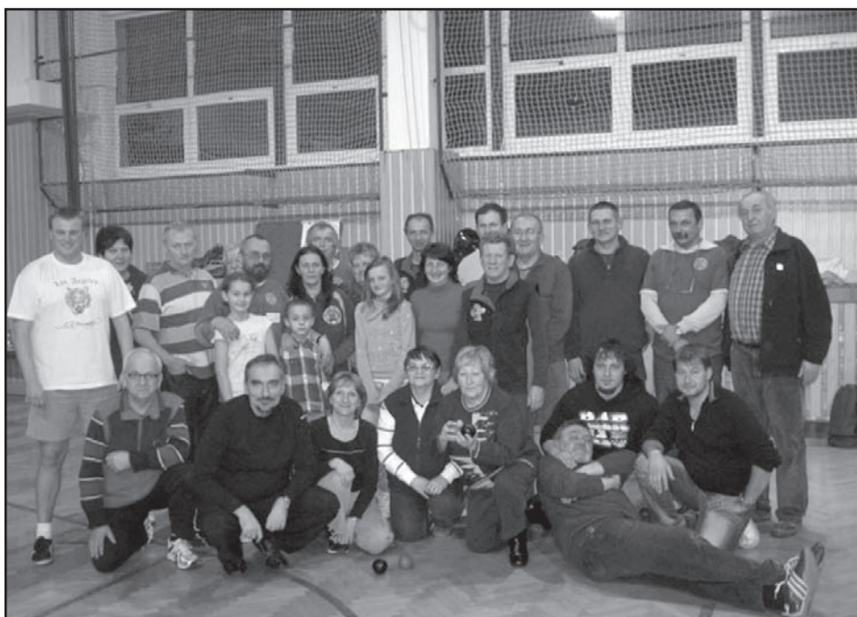
▲ Účastníci finálové části turnaje.