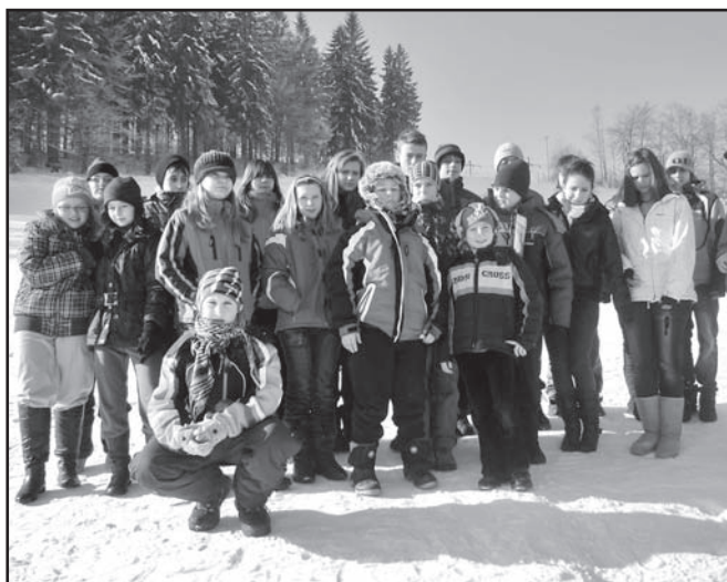
▲ Účastníci LVVZ.