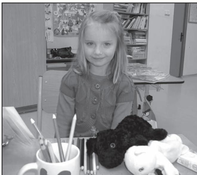
▲ Budoucí školačka.