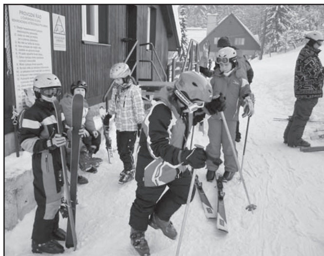
▲ Začínáme s lyžováním.