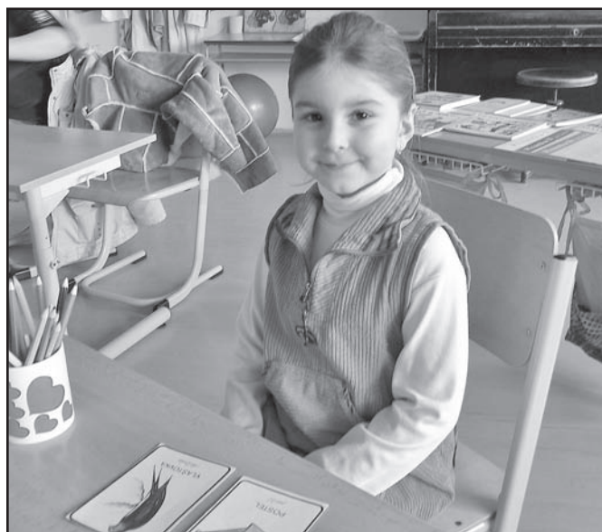
▲ Zápis do 1. třídy.