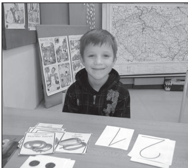
▲ První zk. ze sk. lavice.