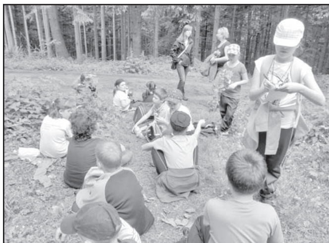
▲ Zielona Szkoła w Rzece.