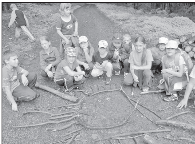
▲ Słońce w Zielonej Szkole.