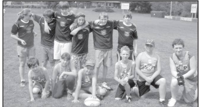
▲ Obě družstva Gorkého a Albrechtic v kategorii benjamin.

Družstvo Albrechtic bylo opravdu družstvem BENJAMIN, protože zde byli hráči z 6. a 4. tříd, kteří se nemohli výkonnostně rovnat k hráčům 7. tříd. Proto také družstvo Albrechtic prohrálo všechna utkání, i když se jim podařilo skórovat proti vítězi této kategorie ZŠ Vybíralova. Družstvo Albrechtic skončilo v kategorii benjamin na pátém místě. Družstvo Gorkého se umístilo na 3. místě.