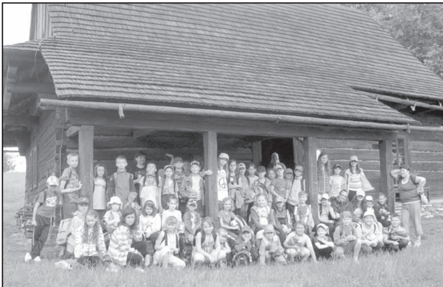
▲ Valašské muzeum v Rožnově pod Radhoštěm.