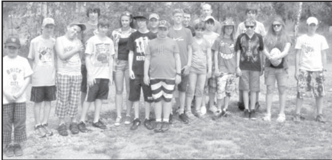
▲ Výprava dorazila na hřiště Tarty Smíchov v Praze ve středu 20. června v 12,55 hod.

F inále Školní ligy ragby se uskutečnilo 20. června 2012 od 13,45 hod na hřišti RC Tatra Smíchov a podle propozic zde hrála smíšená družstva (chlapci a dívky) v kategorii mini (3. – 4. třída ZŠ), benjamin (5. – 7. třída ZŠ) a junior (8. – 9. třída ZŠ). Na finálové turnaje se probíjaly nejlepší týmy pražských základních škol, které od podzimu turnajově bojovaly o body a postup do finále – celorepublikového turnaje Školní ligy ragby. Na tento turnaj se dále kvalifikovaly družstva z Havířova, Albrechtic, Ostravy a Jablonce nad Nisou. Nakonec se turnaje z našeho kraje zúčastnila 3 družstva, jedno družstvo ze ZŠ Gorkého z Havířova (benjamin) a dvě družstva z Albrechtic (junior a družstvo benjamin posíleno o dívku Alici ze ZŠ Gorkého, aby družstvo vůbec splňovalo kritéria účasti).