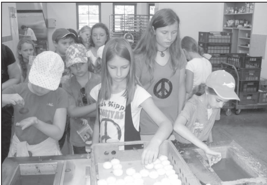
▲ Návšteva v podniku UNIPAR v Rožnově pod Radhoštěm.