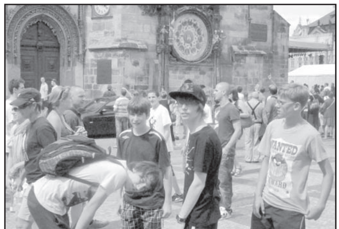
▲ Na Staroměstském náměstí před orlojem.

Příští den po snídani ve formě švédských stolů jsme vyrazili do Prahy, ale převládla nálada v horkém počasí zchladit se ve vodě. Proto jsme navštívili přírodní koupaliště v areálu Edenu, kde jsme také nakonec poobědvali. V centru Prahy jsme pak na Staroměstském náměstí obdivovali orloj, viděli jsme Betlémskou kapli, kde kázal mistr Jan Hus, pak jsme se vydali směrem na Václavské náměstí, které jsme si prošli. Viděli jsme sochu svatého Václava a také budovu Národního muzea. Hlavní budova Národního muzea je však pro rekonstrukci uzavřena. Potom jsme se již vydali na Hlavní nádraží, odkud nás vlak dovezl domů. Do Albrechtic jsme dorazili po deváté hodině večerní.