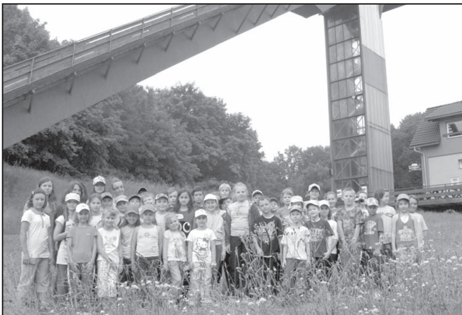
▲ Skokanské můstky ve Frenštátě pod Radhoštěm.