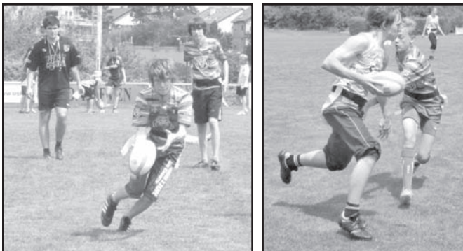
▲ Albrechtičtí umí útočit i bránit.

Družstvo ALBRECHTICE v kategorii junior (8. – 9. třída ZŠ) sice hrálo dobře, ale na velmi fyzicky vyspělé hráče pražských družstev ve dvou případech nestačilo. V kategorii junior startovalo 6 družstev, která se utkala systémem každý s každým a utkání se hrála na 1 x 6 minut. V prvním utkání Albrechtice porazily ZŠ Drtinovu 2:1, v dalším utkání prohrály se ZŠ Jana Wericha 1:4, následně Albrechtice porazily ZŠ Vybíralova II v poměru 3:0 a v dalším utkání prohrály se ZŠ Vybíralova I v poměru 0:3. V posledním utkání pak Albrechtice remizovaly 4:4 se ZŠ Plzeňská. Družstvo Albrechtic skončilo v kategorii junior na čtvrtém místě, když tuto kategorii vyhrála ZŠ Vybíralova I.