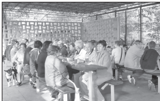
▲ Přátelé a kamarádi ulice Jarní si mají co říci.

Za dobrý nápad a perfektně zorganizovanou akci jim patří dík.