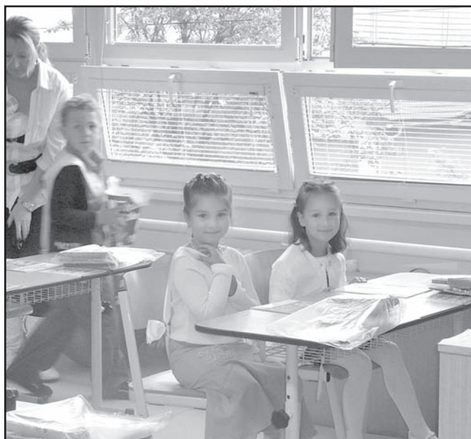
▲ Poprvé ve školní lavici.