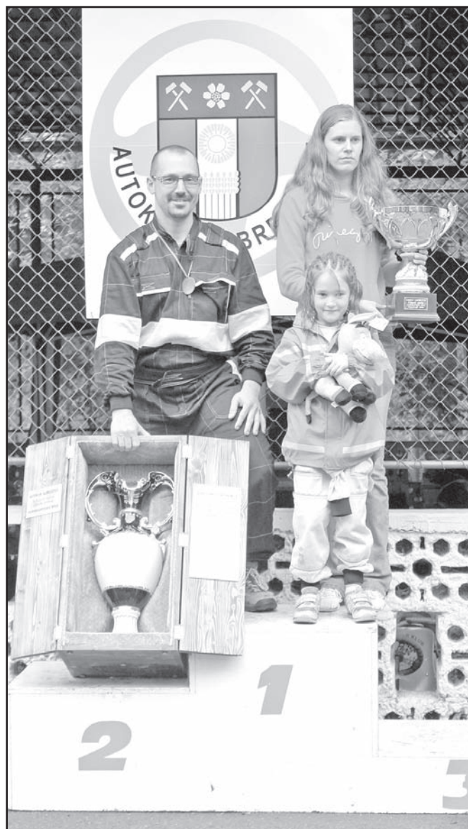
▲ Vítězové XXV AM 2012.