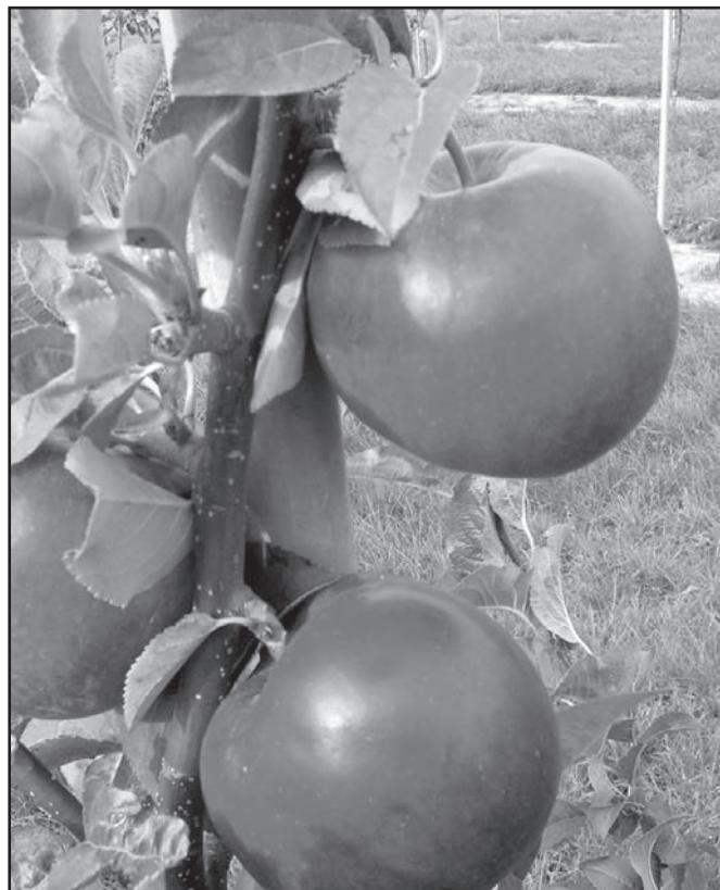
▲ Jablka Tábor.

Růst je nadprůměrný, koruny vytváří vzpřímené, později rozložené, středně husté. Plodnost je raná, velká a při probírce pravidelná. Sklizeň se provádí koncem září, konzumně dozrává v říjnu a dá se skladovat do února. Proti napadení strupovitostí je rezistentní (Vf) a proti napadením padlím jabloňovým je vyšší. Podnože lze použít velmi zakrslé až středně vzrůstné. Středně náročná na polohu, půdy vyžaduje dobře zásobené živinami a vláhou. Kvalitní a atraktivní odrůda pro přímý konzum. Můžeme ji vysazovat do všech oblastí vhodných pro pěstování jabloní. Nejlepší kvality dosahují plody ve středních a teplejších polohách.