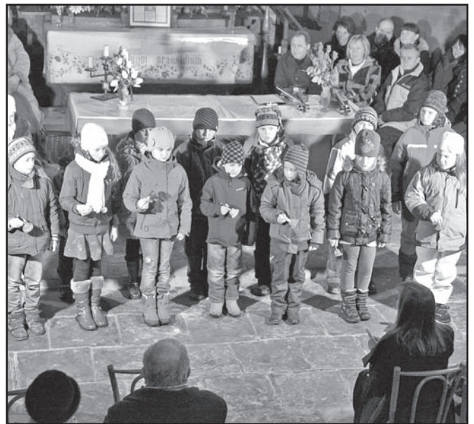
▲ Dzieci z Polskiej Szkoły Podstawowej w Olbrachcicach w zabytkowym kościółku.

W ostatnich miesiącach wychowankowie przedszkola i uczniowie szkoły z polskim językiem nauczania, pomimo zimowej i zaśnieżonej aury, niezmiennie wywiązywali się ze swoich obowiązków i korzystali z przyjemności. W grudniu tradycyjnie odwiedził nas Mikołaj, który tym razem przyprowadził ze sobą Królową Śniegu. Lodowa Pani dzielnie pomagała w rozdawaniu słodkich upominków wszystkim grzecznym dzieciom... te nie zawsze gruczne musiały prezent wykupić piosenką lub wierszykiem, lecz na szczęście szczodry Mikołaj docenił wysiłki wszystkich pociech. W Nowym Roku 12 stycznia odbyła się kolejna edycja wspólnego kolędowania, które od kilku już lat odbywa się w olbrachcickim drewnianym kościółku. Zaproszonych gości nie odradził nawet duży mróz i wszyscy licznie stawili się, by obejrzeć przygotowany program. Dzieci z przedszkola zaprezentowały wiersze i piosenki o tematyce zimowej, zaś uczniowie szkoły mogli pochwalić się tańcem oraz zaskakującym akompaniamentem do kolędy „Cicha noc“ wykonanym na ręcznych dzwonkach chromatycznych. Zaśpiewał także Chór Mieszany działający przy MK PZKO oraz zespół „Kamraci“, który przygotował starsze, zapomniane już kolędy i pastorałki śpiewane dawniej na naszym terenie. 17 stycznia odbyły się zapisy do naszej szkoły i przedszkola. W przyszłym roku szkolnym do przedszkola uczęszczać będzie nadal dwudziestka dzieci a do szkoły piętnaścioro uczniów. Do klasy pierwszej zapisały się dwie dziewczynki Anetka Santarius i Terezka Pasz.