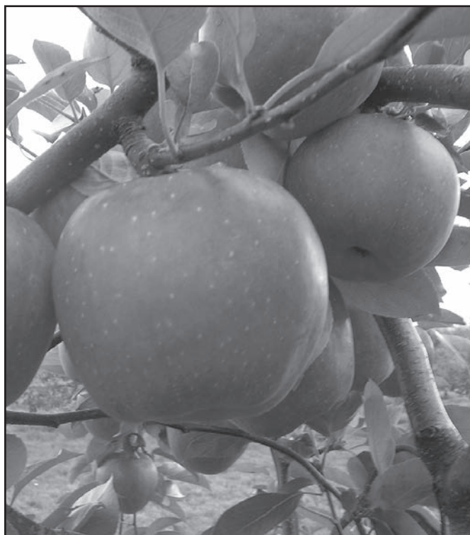
▲ Jablka Blaník.

Blaník - plody jsou střední až nadprůměrné velikosti, kuželovitého tvaru s malými žebry. Slupka je lesklá, ojíňená, středně tlustá, základní barvu překrývá červené rozmyté líčko téměř na celém povrchu plodu. Dužnina je světle krémové barvy, středně pevná, rozplývavá, středně až více šťavnatá. Chuť je navinule sladká, aromatická, velmi dobrá až výborná. Plodnost je brzká, velká a pravidelná. Sklizeň se provádí koncem září, konzumně dozrává v listopadu, dá se skladovat do února až března. Odolnost proti strupovitosti je rezistentní (Vf), proti napadení padlím jabloňovým je střední až vyšší a vyšší je i odolnost proti fyziologickým poruchám dužniny. Odrůda je vhodná pro přerobování zdravých stromů a lze ji vysazovat ve všech polohách vhodných pro jabloně. Více o odrůdě na internetu - google Blaník - nová perspektivní odrůda.