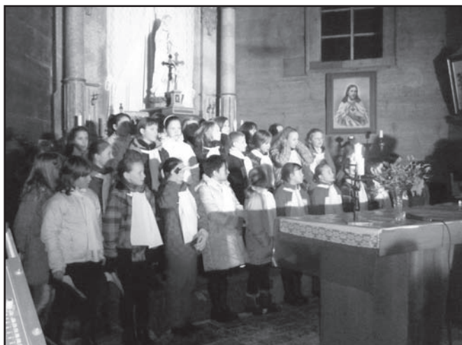
▲ Koncert v dřevěném kostele.