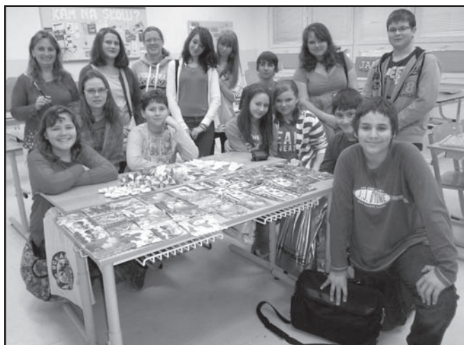
▲ Den tradic - výrobní den.