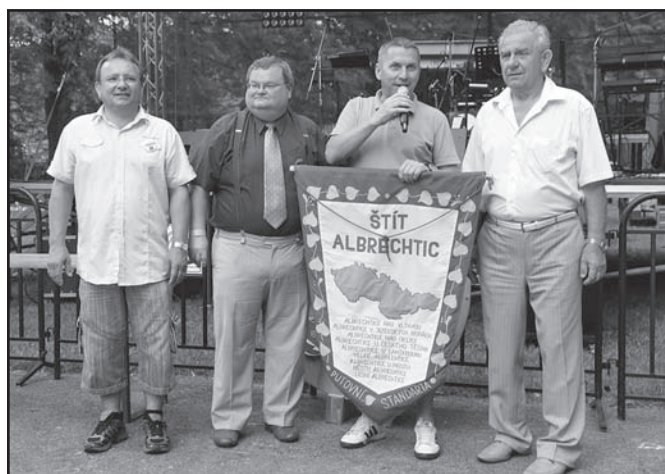
▲ Předání putovní vlajky pořadatelům 41. ročníku Štítu Albrechtic (Albrechtice v Jizerských horách).