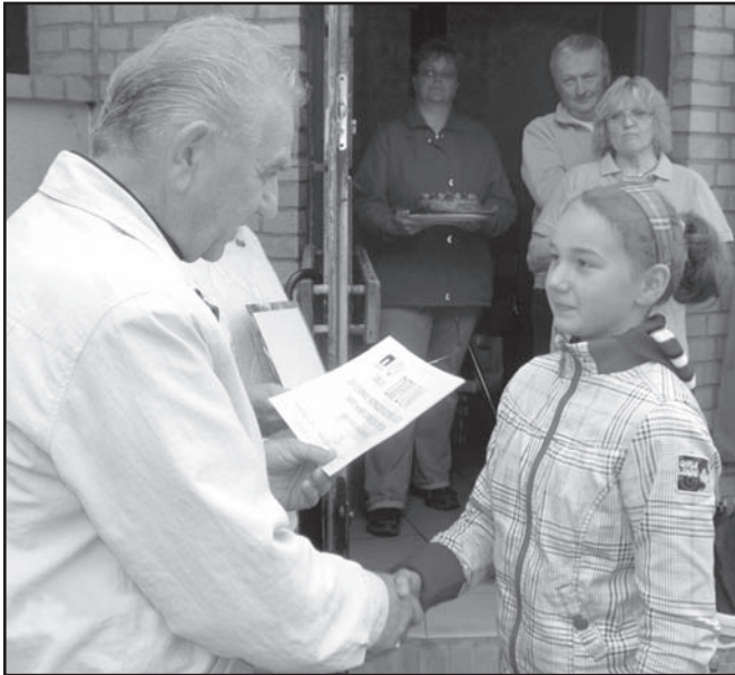
▲ Předávání ocenění juniorům.

Letní období je náročné pro všechny hráče pétanque. Každý víkend se hraje dle rozpisu na domácí anebo republikové či zahraniční půdě!