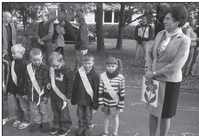
▲ Žáci 1.A.