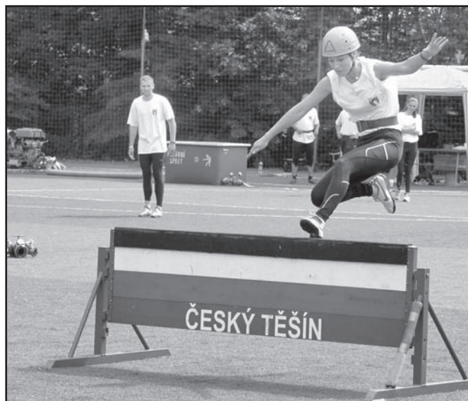
▲ ...ze soutěže družstev žen v hasičském sportu.