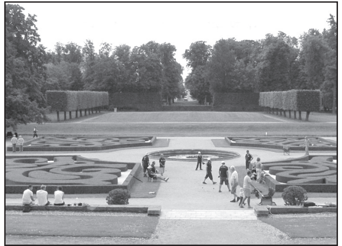
▲ Jaroměřice nad Rokytnou.