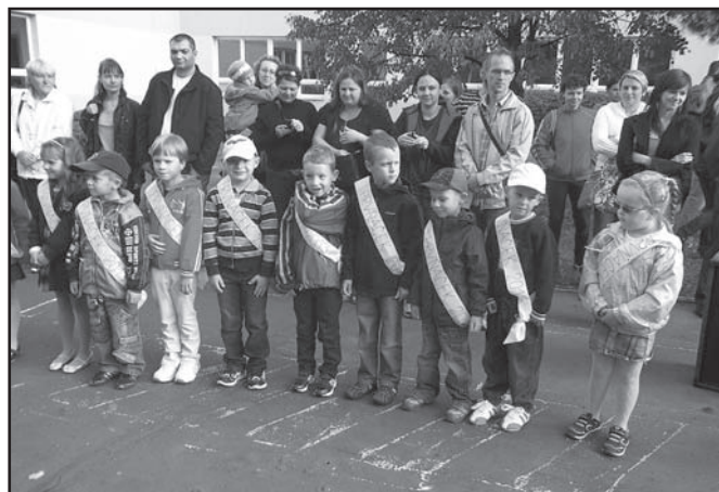
▲ Žáci 1.B.