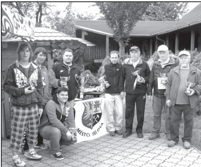
▲ Turnaj Memory Cup v Orlové.

Další zkouška se konala v Olomouci 25.5.2013 a to MČR žen. Družstvo Albrechtic se takového turnaje účastnilo poprvé a skončilo na 7. místě. Ve stejném termínu se konal v Orlové turnaj Memory Cup, kde jsme obsadili 2. a 3.místo.