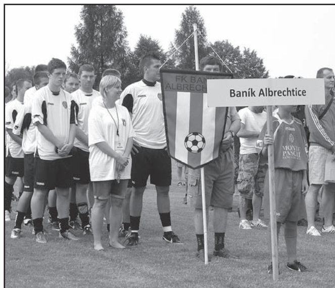
▲ Záhájení turnaje - nástup sportovců.

Oznámení o době a místě konání voleb v obci Albrechtice bude zveřejněno v zákonem stanovené lhůtě na úřední desce Obecního úřadu Albrechtice.