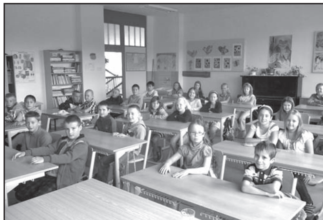
▲ Zahájení školního roku 2013/2014 ve 4.A.