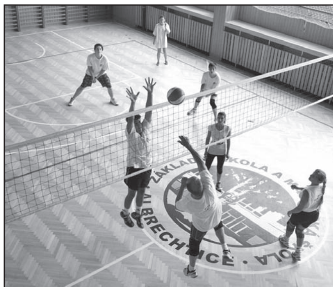
▲ Turnaj volejbalistů.