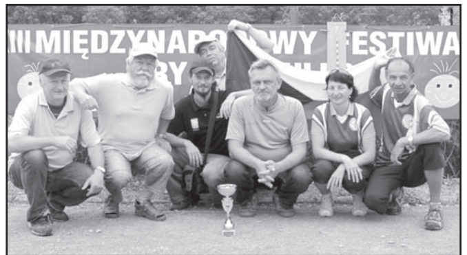
▲ Mezinárodní pétanque festival v polském městě Żywiec.

Každoročně probíhá v polském městě Żywiec, mezinárodní pétanque festival, kterého se pravidelně účastníme. Letos jsme v družstvu ČR získali Pohár národů, který zdobí naši galérii úspěchů!