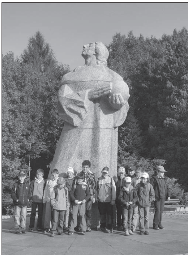
▲ Wycieczka Chorzów - planetarium.

W piękny słoneczny dzień 9.10.2013 zwiedziliśmy wraz z uczniami z Cierlicka chorzowskie planetarium oraz ogród zoologiczny. Sam słynny pomnik Mikołaja Kopernika „odżył” i astronom opowiadał nam bardzo ciekawie o wszechświecie i gwiazdach na niebie. Wycieczka była naprawdę bardzo udana, Dziękujemy Stowarzyszeniu Wspólnota Polska oraz Towarzystwu Nauczycieli Polskich w Republice Czeskiej za dofinansowanie biletów wstępu oraz naszej Macierzy Szkolnej za pokrycie kosztów przejazdu autobusem.