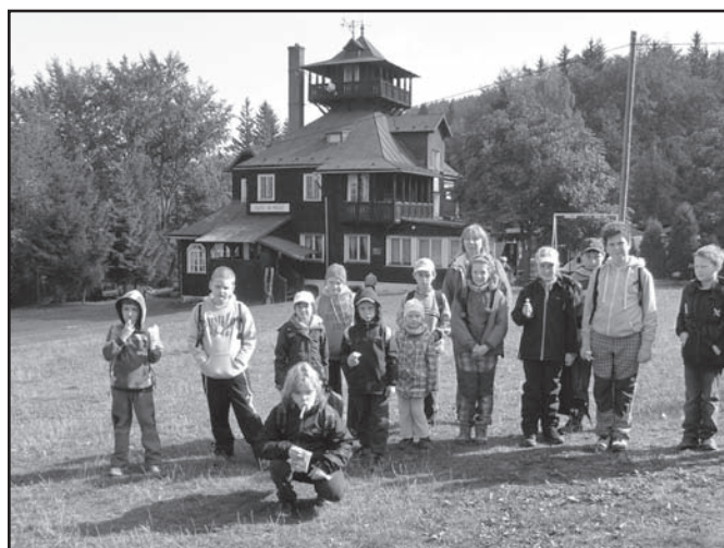
▲ Zielona szkoła - na Praszywej.

W ramach tegorocznego szkolnego projektu Nasze Beskidy - nasz kraj rodzinny, wyjechaliśmy do Zielonej Szkoły w Ligotce Kameralnej, gdzie zdobyliśmy wszystkie okoliczne szczyty: Godulę, Praszywą, Ropiczkę i Kotarz. Następnie zwiedziliśmy poplenerową wystawę Beskidy 2013 artystów plastyków w Czeskim Cieszynie, gdzie dzieci zdobywały wiedzę o sztuce malarskiej i nie tylko. Na lekcji wychowania plastycznego uczniowie próbowali sami wykonać repliki wybranych przez siebie obrazów, porównywali różne techniki malarskie. Próbowali opowiedzieć o atmosferze panującej na konkretnym obrazie. Wystawa bardzo się wszystkim podobała.