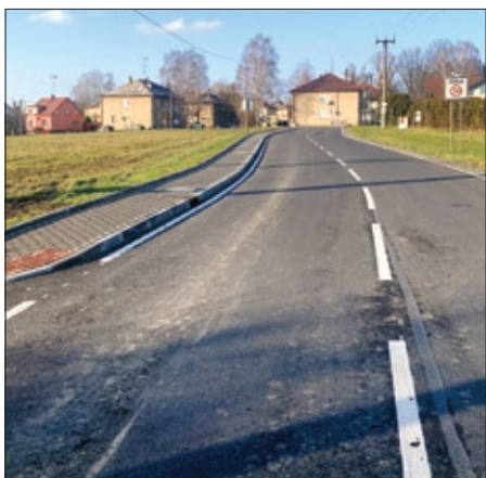
Nový úsek ul. Nádražní – firma EURO-GAS.

na začátku letošního roku vypadalo vše moc nadějně. Začalo to u našich hasičů, kteří po šesti letech snažení obdrželi novou cisternu. Pak jsme byli informováni z MF ČR, že na základě naší žádosti byl schválen projekt v rámci revitalizace území dotčeného těžbou uhlí tj. dokončení komunikace ul. Nádražní. Jako jediné obci v okrese se nám tak podařilo během čtyř let realizovat všechny tři projekty – most, odkanalizování části Nový svět a dokončení komunikace na ul. Nádražní financovaných Ministerstvem financí ČR za celkem 23 mil. Kč. Pak nastala, nejenom u nás, zcela nová situace – boj s Covid 19. Byla to výzva, se kterou bojujeme dodnes. Přes veškerá omezení se nám dařilo realizovat kromě rekonstrukce Dělnického domu i další akce menšího rozsahu.