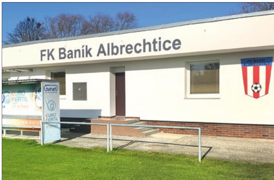
Rekonstrukce areálu FK Baník – firmy Farma Stonava a DK Plant.

Závěrem mi dovoluji, abych vyzval všechny naše provozovatele tzv. „ekologických topenišť“, aby pořádně zkontrolovali svoje kotlíky, než začnou sobě a zejména svým sousedům trávit okolní