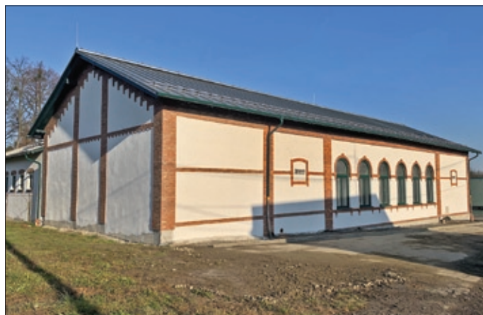
Rekonstrukce Dělnického domu – firmy BDSTAV MORAVA a Farma Stonava.