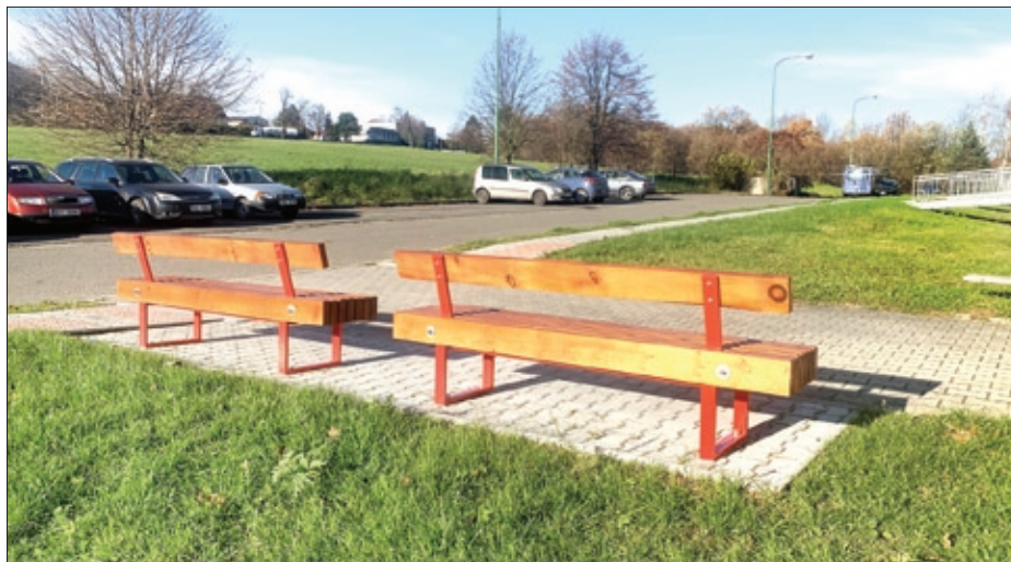
Oprava chodníku, ul. Hornická – firma DK – PLANT.