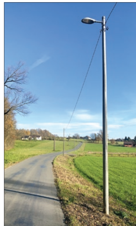
Veřejné osvětlení na ul. Pasecká – PHELEKTRO.