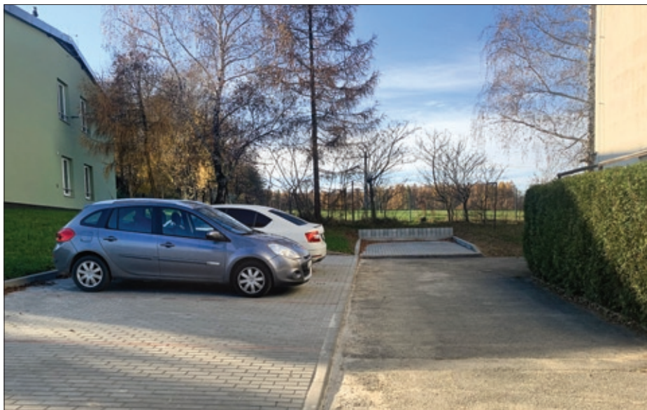
Parkoviště ul. Bělehradská – firma K2 – stavební.

ovzduší. Jedná se o zdraví nás všech. Obec v minulých letech vynaložila nemalé prostředky na plynofikaci. Jsou však mezi námi i takoví, co čerpali dotace v další etapě na kotle na tuhá paliva a nyní jsou schopní zaměřit nejen svůj pozemek, ale i okolí a tváří se dotčeně, pokud je na to sousedé upozorní. Chraňme prosím sebe i okolí.