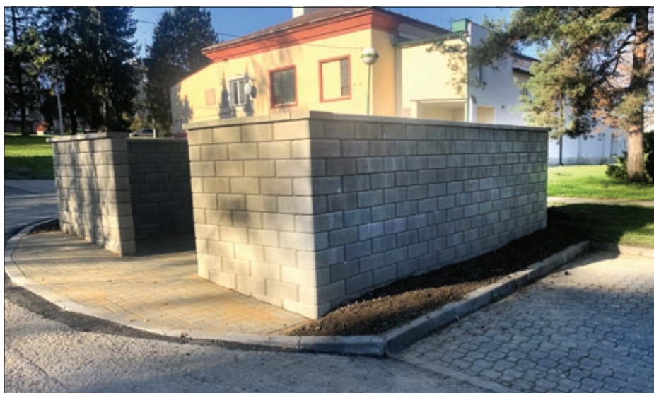
Plocha pro kontejnery – firma PIKONE.