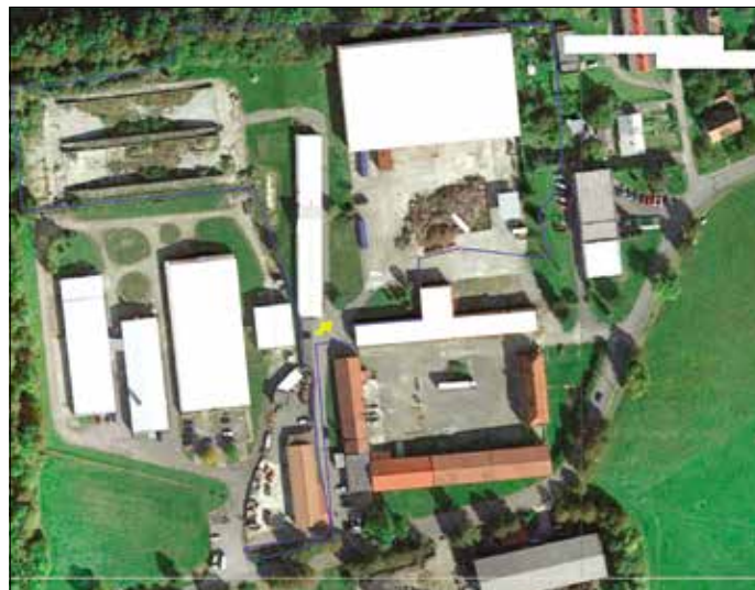
Letecký snímek původní zástavby firmy AGRO – EKO, s.r.o. Albrechtice.

S ohledem na povahu svých plánovaných aktivit, požádala společnost Rondo Plast, s.r.o. o zhodnocení vlivu své činnosti na životní prostředí, přičemž tuto žádost posuzovalo jako věcně příslušný orgán státní správy Ministerstvo životního prostředí v roce 2020. Informace o zahájení zjišťovacího řízení doručena ministerstvem obci byla v roce 2020 zveřejněna na úřední desce obce (vyvěšeno bylo od 16. 11. – 4. 12. 2020),