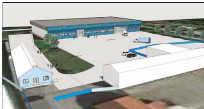
Vizualizace plánovaných stavebních úprav nového majitele Rondo Plast, s.r.o. Albrechtice.

proto každý občan měl možnost se s obsahem záměru společnosti seznámit a případně i uplatňovat své námítky.