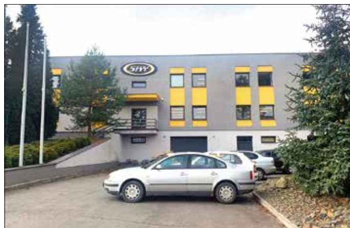
Názorná ukázka proměny realizované firmou Sky Paragliders – před a po realizaci.