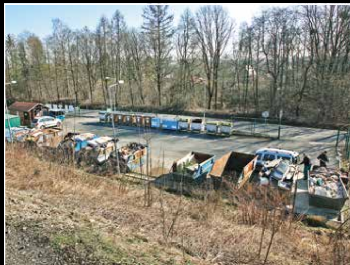
Na fotografii z druhé poloviny 80. let XX. století pohled z železniční tratě na bývalou budovu železniční stanice, pak hospody Na Rakovci. V nejší době ma tomto místě se nachází sběrný dvůr.