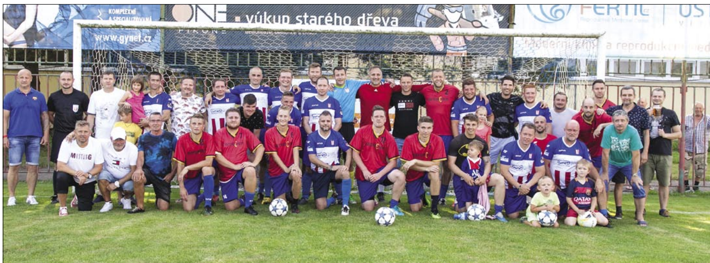
Společná fotografie kádru Baníku Albrechtice se starou gardou.