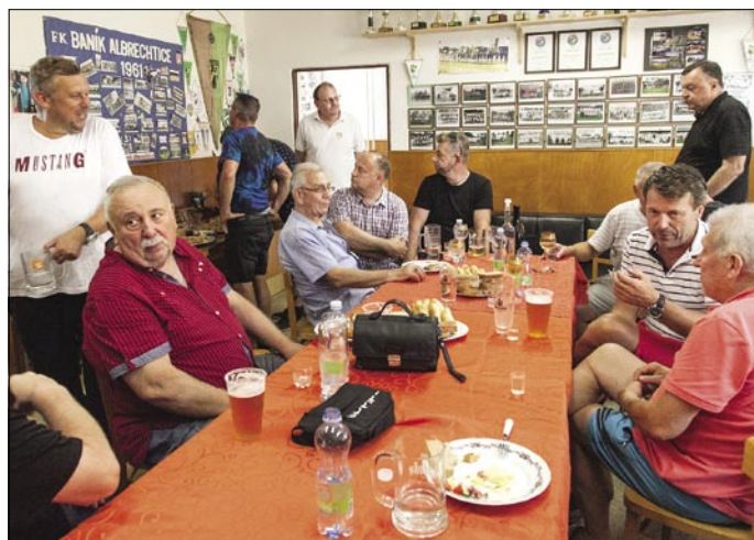
Setkání bývalých a současných funkcionářů v klubovně.