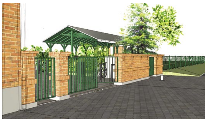
Vizualizace parkoviště a zahrady Dělnického domu.