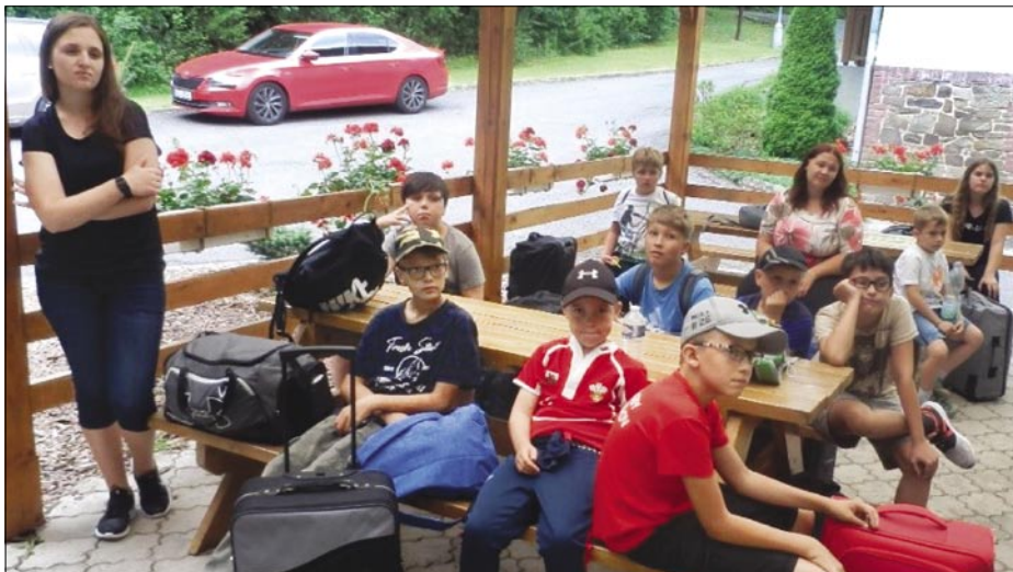
Albrechtická pětice na soustředění u prvního stolu.

Činnost školního kroužku ragby byla velmi omezena restrikcemi kvůli COVID 19. Přesto se v měsíci únoru uskutečnilo celkem 5 tréninkových jednotek, kdy děti musely cvičit pouze ve dvojicích a to ještě s dvoumetrovými rozestupy. Tyto tréninky se uskutečnily na travnaté ploše u restaurace Na Zámostí a byly zaměřeny na běh, obratnost a přihrávky se šišatým míčem.