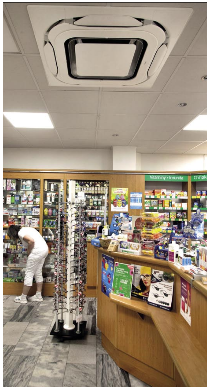
Klimatizace byla instalována ve všech prostorách našeho zdravotního střediska.