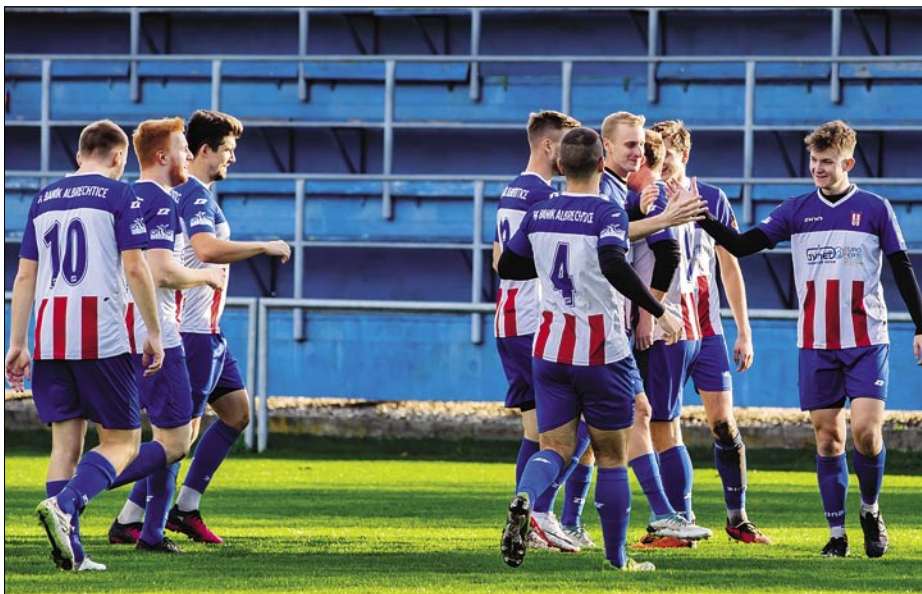
Muži – FK Baník Albrechtice

hlavně Obci Albrechtice za neuvěřitelné podmínky vytvořené všem týmům. Na závěr bych chtěl poděkovat také trenérům dorostenců za perfektní spolupráci.“