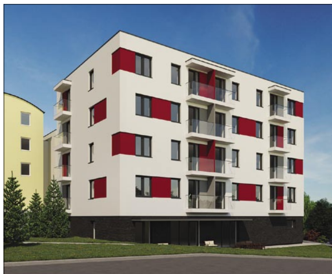
Vizualizace komunitního domu pro stávající klienty domu s pečovatelskou službou.