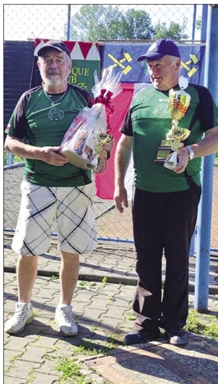
Staříčský pohár – 1. místo.

Do Hrabyně (viz výše) nás nejelo více jenom pro to, že někteří z nás dali přednost turnaji ve Staříči, hraném ve stejném termínu – 15.6. Ukázalo se to jako