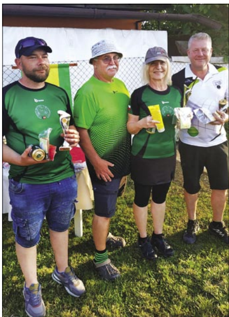
Hrabyně – 2. místo.

Letošní ročník domácího turnaje jednotlivců vyšel na Den dětí. Shodou okolností se ve stejný termín konalo také MČR trojic. Tato skutečnost (a také relativně blízký turnaj v Polsku) způsobila, že kapacita našeho turnaje nebyla naplněna do 2 minut od otevření přihlašování (což je běžná věc), ale naopak jsme se potýkali s nedostatkem hráčů. Nakonec se nás sešlo 24, což je přesně spodní hranice, aby se výsledky turnaje započítávaly do celostátního žebříčku.