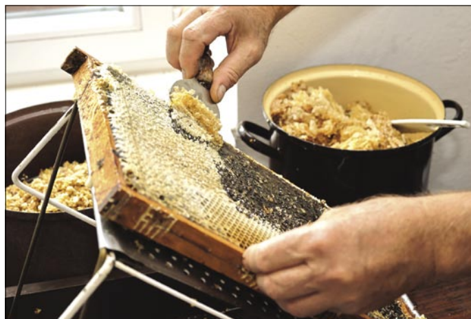
Příprava před vytáčením medu: odvíčkování medových plástů.