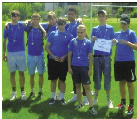
Družstvo Junior ze ZŠ Albrechtice, které skončilo na třetím místě.

Tento rok se turnaj v Tag ragby konal v úterý 28. května 2024 na ragbyovém hřišti RC Havířov a turnaje se tentokrát zúčastnilo pouze pět škol. Turnaj byl určen pro dvě věkové kategorie – Benjamin pro žáky 6. a 7. tříd a Junior pro žáky 8. a 9. tříd. Družstva jsou smíšená, hrají