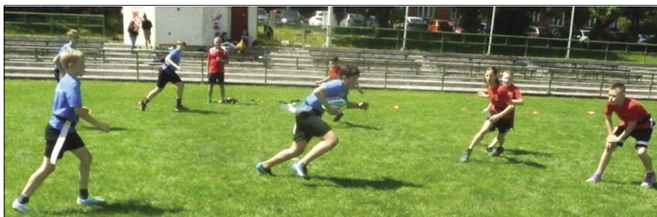
Utkání kategorie Benjamin mezi ZŠ Albrechtice (v modrém) a ZŠ Gorkého.