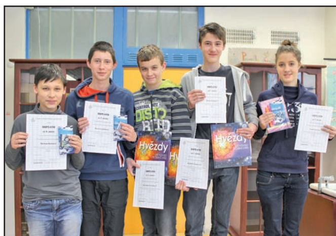
▲ Astronomická olympiáda.