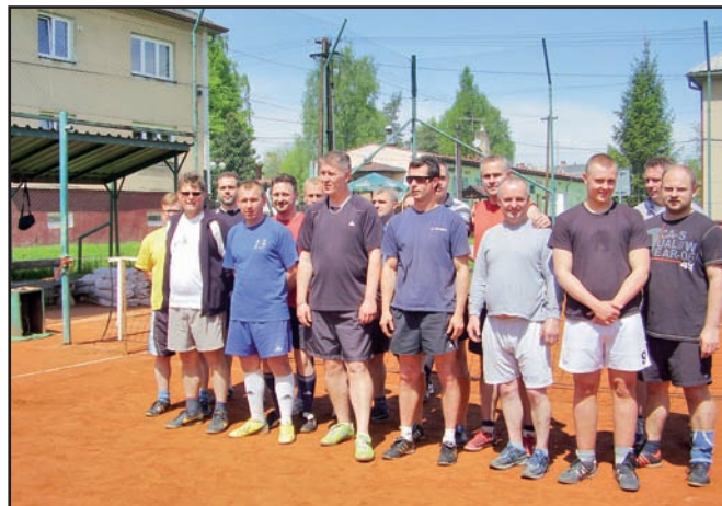
▲ Nohejbalový turnaj.

Dne 16.5. se v prostorách tělocvičny Základní školy uskutečnil již 16. ročník Volejbalového turnaje smíšených družstev „O pohár mikroregionu Žermanické a Těrlické přehrady“. Turnaje se zúčastnily družstva Horních Bludovic, Soběšovic, Těrlicka a Albrechtic. Pořadatelem bylo družstvo Těrlicka.