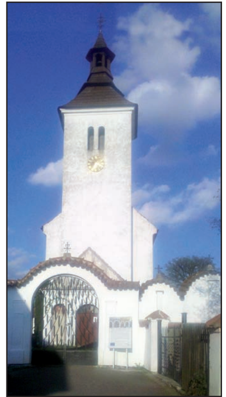
▲ Kostel sv. Petra a Pavla v Albrechticích nad Vltavou.