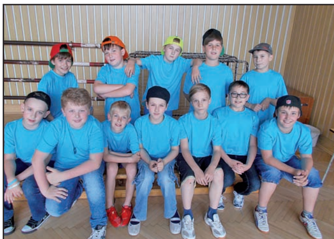
▲ Páni kluci v modrém.

Dívky z 5.A a 9. A při návratu na Radovánky.