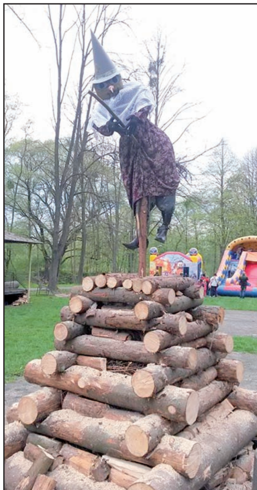
▲ Připravená čarodějnice.