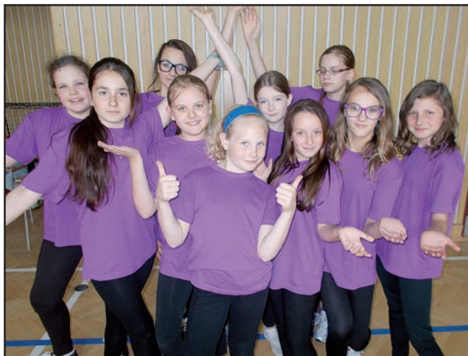
▲ Fialová nám sluší...

Dívky z 5.A a 9. A při návratu na Radovánky.