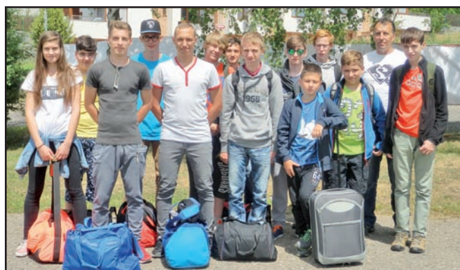
▲ Naše výprava po příjezdu na hřiště Tatry Smíchov.

D ružstvo ZŠ Albrechtice jako vítěz Havířovské školní ligy Tag rugby pro rok 2014/2015 postoupilo do finále Celostátního turnaje v Praze společně s druhým družstvem ze ZŠ Gorkého. Obě družstva startovala v kategorii Junior. Celostátní turnaj se konal v úterý 16. června 2015 v Praze na ragbyovém hřišti RC Tatra Smíchov pro kategorie Junior (8. až 9. třída ZŠ), Benjamin (6. až 7. třída ZŠ) a Mini (3. až 5. třída ZŠ). Všechna utkání se hrála na 2 x 4 minut a hrálo se na hřišti o rozměrech 25 x 40 metrů.