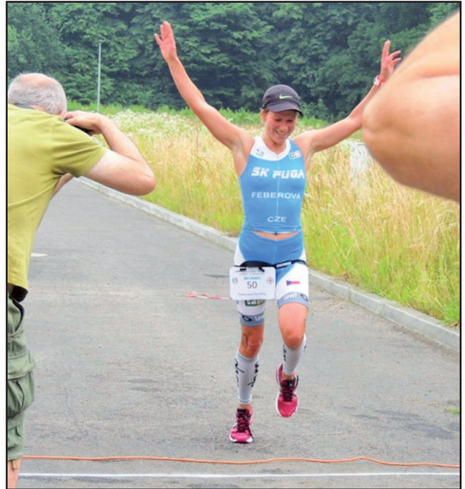
Karviná, Obecní policie Albrechtice, Policii ČR obvodní oddělení Těrlicko a členům SDH Karviná – Ráj a Stonava.

Velké poděkování patří Obci Albrechtice za finanční podporu těchto závodů. Dále děkujeme Těšínským jatškám, Obchodnímu domu Billa, Glogus, Tesco a firmě Comfor. Děkujeme taktéž všech organizátorům a členům Českého červeného kříže