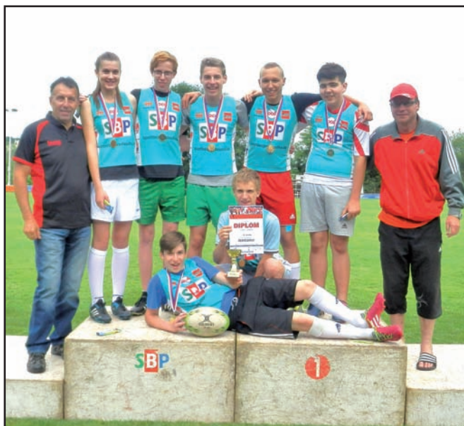
▲ Vítězné družstvo ZŠ Albrechtice.