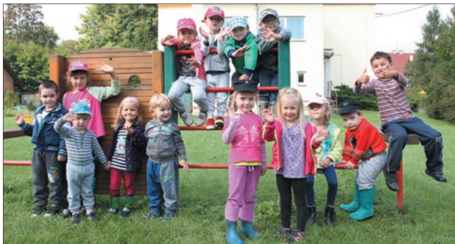
W przedszkolu Wesola Biedronka fajnie jest.

Choć nasze myśli krążą jeszcze czasem wokół wakacji, powoli odnajdujemy się w przedszkolnej codzienności. Podczas ciekawych zajęć uczymy się bawiąc i bawimy ucząc. Jak co roku czekają nas liczne uroczystości, występy, wyjścia do teatru i wiele innych atrakcji, na które nie możemy się już doczekać. Planujemy również pierwszą wspólną wycieczkę do zaprzyjaźnionej placówki w Orłowej. Starszaki odwiedzą tym samym kolegów z wiosennego wyjazdu