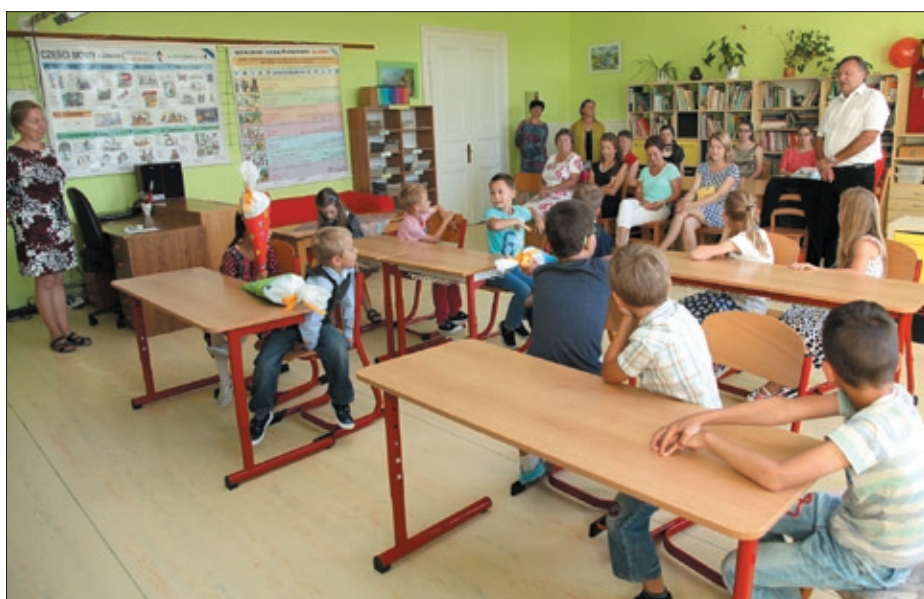
Uroczyste otwarcie nowego roku szkolnego.