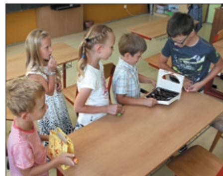
Na dobry początek... czekoladki!