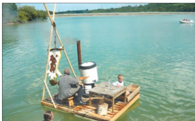
Vítězná plavidlo vydrželo od startu až do cíle kompletně.