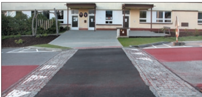
Retardér před mateřskou školou.