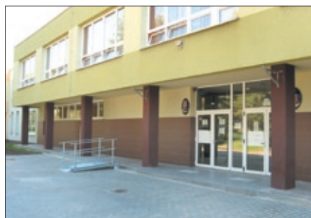
Nový vstup do školy.

Nezměnila se nám však k lepšímu pouze budova školy, ale i její okolí. Před školou již není nevzhledný asfaltový povrch, ale krásná zámková dlažba, na níž najdeme i nápaditého skákacího panáka. Zároveň byl vybudován nový krásný vstup do školy a byla vyměněna dlažba venkovní terasy. Vše dokreslují