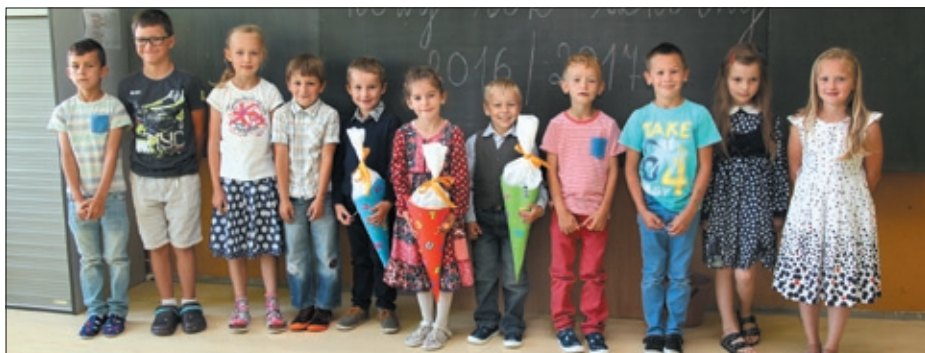
Uczniowie Polskiej Szkoły Podstawowej.