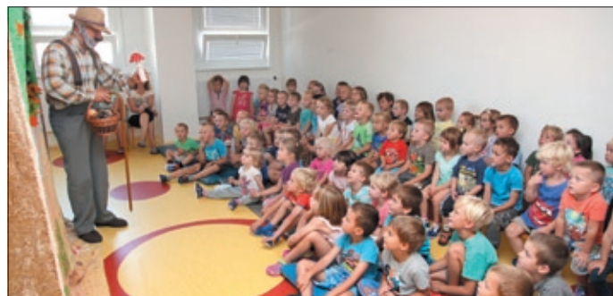
Nově zrekonstruované prostory.

Ještě v červenci se ozývaly v naší školce veselé hlasy dětí zaměstnaných maminek a užívaly si nabídky letních činností, většinou na školní zahradě a v přírodě. O měsíc později prošly přízemní prostory MŠ velkou proměnou. V roce 2003 přešla naše mateřská škola, která neměla právní subjektivitu, pod zdejší základní školu. Během následujícího léta byla školka vybavena novým nábytkem ve třídách, postupně každým rokem se zrekonstruovaly dětské umývárny a záchodky.