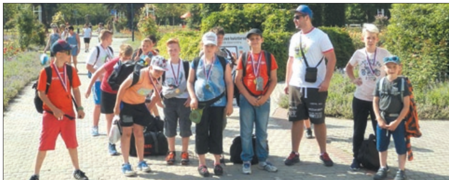
V růžové zahradě před petřínskou rozhlednou.