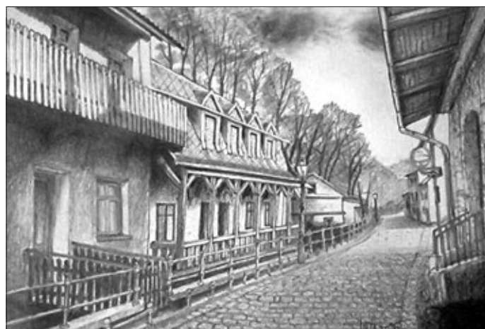
Cieszyn, Cieszyńska Wenecja.