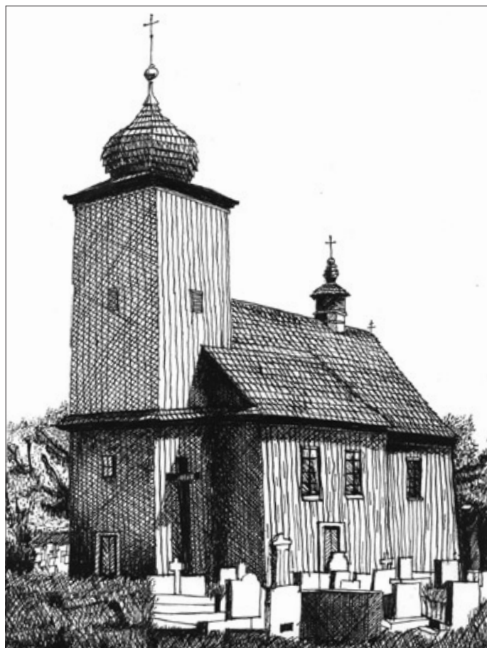
Olbrachcice, drewniany kościółek.