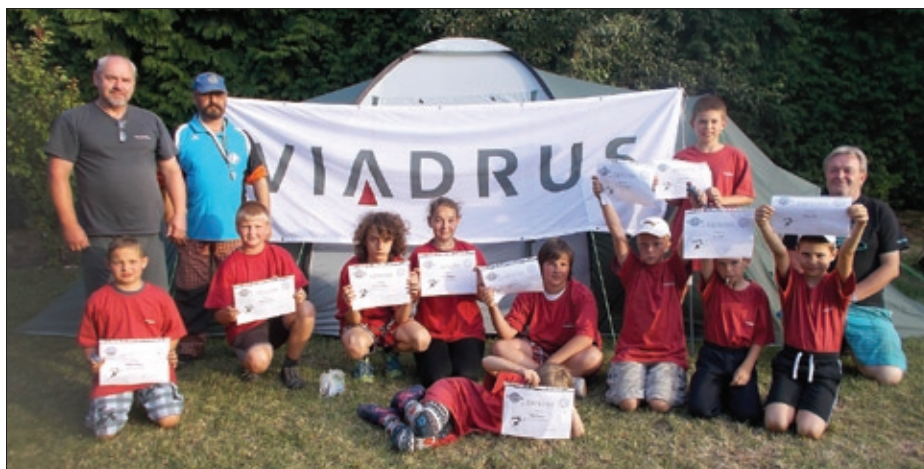
Účastníci letošního soustředění juniorů Litovel 2016.