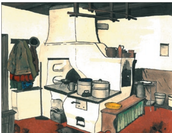
Piec z otwartym paleniskiem.