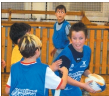
Snímek z 2. turnaje z utkání ZŠ Albrechtice (v modrém) proti ZŠ Gorkého.

Druhý turnaj se hrál systémem každý s každým a všechna utkání se hrála v čase 2x4 minuty. Družstvo ZŠ Albrechtice nejprve zvítězilo nad družstvem ZŠ Gorkého v poměru 4:3, v dalším utkání pak družstvo ZŠ Albrechtice nestačilo na družstvo RC Havířov a prohrálo v poměru 1:3 a v posledním utkání pak družstvo ZŠ Albrechtice zvítězilo nad družstvem „Havířováci“ (složené z náhradníků zúčastněných družstev) v poměru 3:2. Celkové vítězství v turnaji si vybojovalo družstvo RC Havířov, které zvítězilo ve všech utkáních, druhé místo obsadilo družstvo ZŠ Albrechtice (dvě vítězství a jedna porážka), na třetím