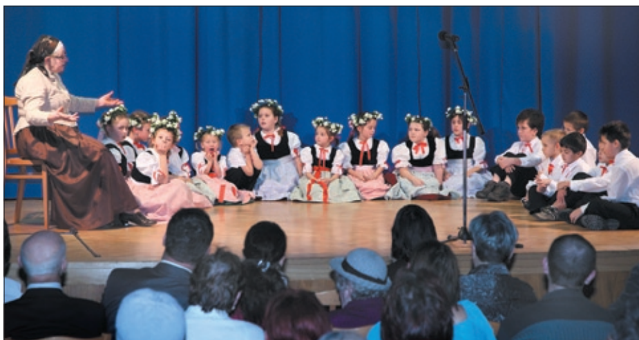
Teatryk Dzieciątka „Drops” na scenie Domu PZKO w Olbrachcicach w 2011 r.

Każda działalność jakiegokolwiek organizacji bez aktywnego udziału członków nie jest efektywna. Zapraszamy więc Szanownych członków i sympatyków do uczestniczenia w imprezach Miejscowego Koła, do wspólnych spotkań w Domu PZKO. Zapraszamy aktywnych Panów do Klubu Seniora, Panie do Klubu Kobiet. Można w ten sposób urozmaicić sobie życie emeryta. Zapraszamy najmłodszych członków i młodych, już dorosłych, do aktywnego uczestniczenia w życiu pezetkaowskiej społeczności.