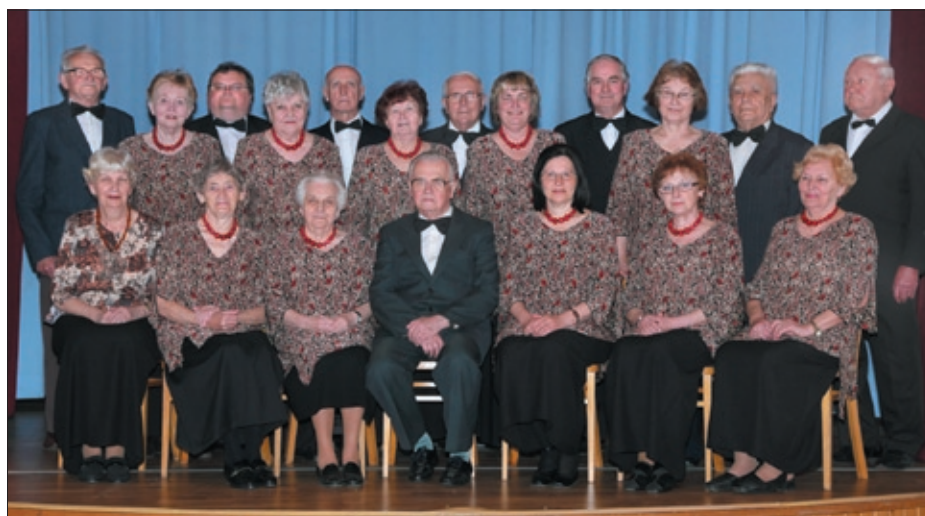
Chór mieszany Miejscowego Koła PZKO w Olbrachcicach w 2011 roku.

2010 Konsulat Generalny RP w Ostrawie. W częściowej rekonstrukcji ogrzewania, wymiany krzeseł i wymiany okien na parterze pomogła Gmina Olbrachcice, który jednocześnie wspiera Koło corocznie dotacją na działalność kulturalną. Dlatego możemy sobie od czasu do czasu pozwolić zaprosić inne zespoły. Poza tym sekretariat Urzędu Gminy pomaga Kołu