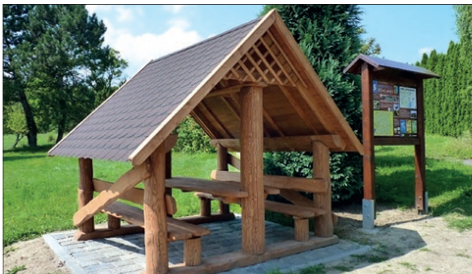
Jak lze vidět na fotografii, zastřešené posezení již funguje a instalace informačního panelu proběhne během měsíce března.

ŠÁRKA HUGÁŇOVÁ, referent úseku vnitřních věcí, Obecní úřad Doubrava