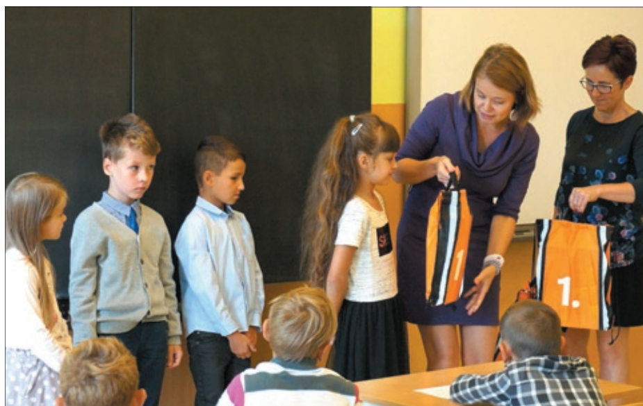
Macierz Szkolna rozdaje wyprawki szkolne pierwszoklasistom.