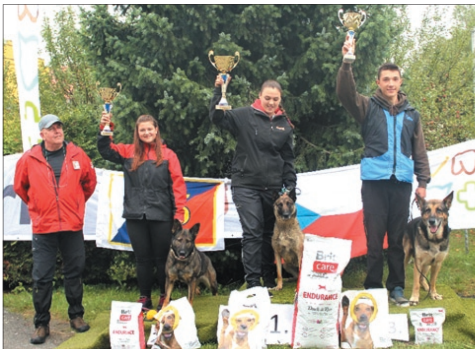
Kategorie fpr – 3 – mládež.