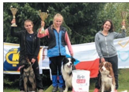
Kategorie fpr – 1.