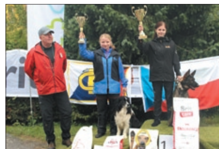
Kategorie fpr – 1 – junior.