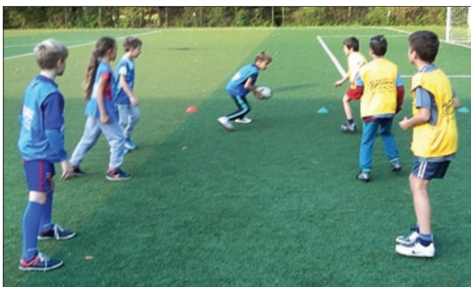
Říjnové tréninkové utkání na školním hřišti.

V listopadu jsme již trénovali pouze v tělocvičně ZŠ Albrechtice. Tréninky byly zaměřeny na všeobecnou obratnost, rychlost (formou závodivých her) a na hry – fotbálek, košíková, zjednodušená odbíjená – přehazování a chytání míče přes síť a samozřejmě ragby, kdy se střídá bezkontaktní forma s formou kontaktní.