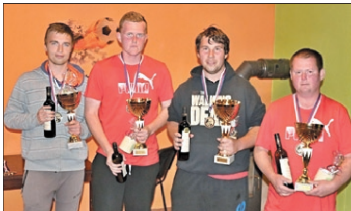
Mistrovství České republiky mužů – 2017, 2. místo.

Pravidelní čtenáři zpravodaje si možná v minulých číslech všimli, že se pétanque poněkud odmlčel. Uvedený půst se naštěstí týkal pouze publikační činnosti, nikoliv pravidelných tréninků a herního zápolení.