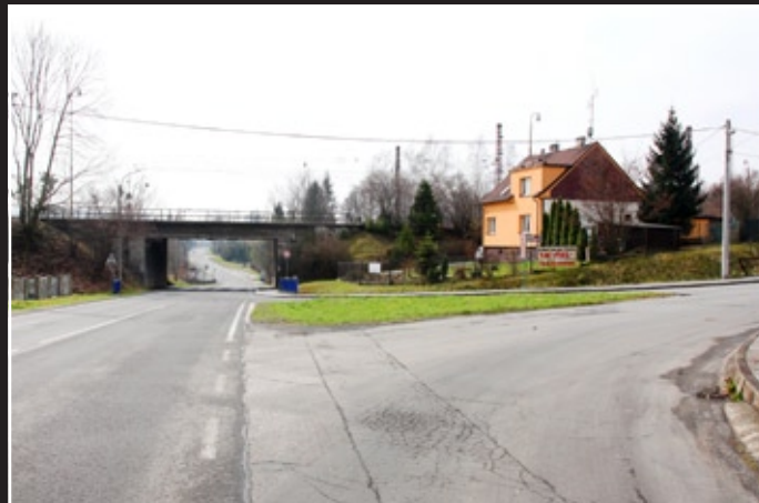
Fotografie z 50. let XX. století dokumentuje hlavní cestu směřující ze Stonavy. V pozadí je vidět starý železniční most. Na současném snímku je zachycena křižovatka ul. Stonavské z ul. Nádražní.