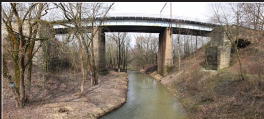
Na fotografii z 50. let XX. století pohled na starý železniční most přes řeku Stouňávku. Na novodobém snímku jsou vidět zbytky zbouraného mostu. V pozadí aktuálně používané přeústění řeky.