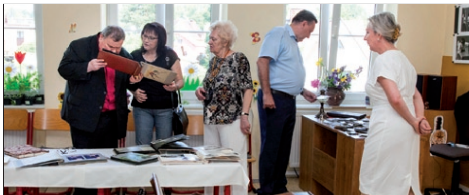
Wystawa starego sprzętu szkolnego, podręczników, kronik, zdjęć...

Po przedstawieniu na scenę do dzieci dołączyło grono pedagogiczne, które nieraz już zaskakiwało talentem wokalnym i instrumentalnym. W kombinacji z profesjonalną oprawą muzyczną panie