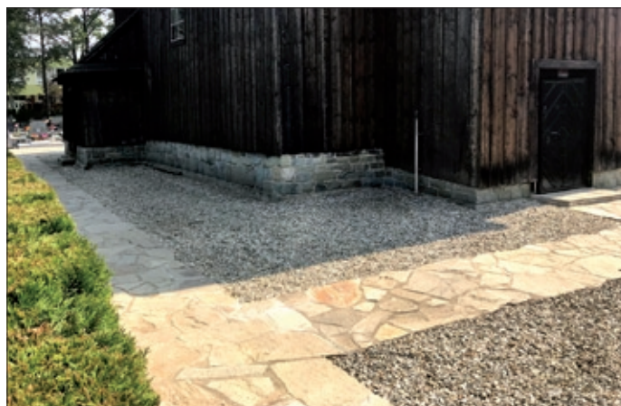
Nový chodník kolem dřevěného kostela.