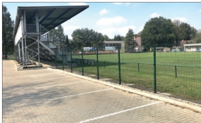
Nové oplocení a parkoviště kolem hřiště.