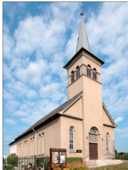
Kostel po 70 letech.

Je vidět, že ve své práci nezhálíme a okolí našeho kostela patří k nejkrásnějším místům obce. Obci Albrechtice jsme také vděční za příspěvky na významnější investice (2006 střecha kostela, 2016 schody a 2018 vytápění fary). Ale největšími dárci jsou obyčejní lidé, kteří nelitují času, námahy ani financí na další rozvoj sboru. Těm patří naše velké poděkování. Dá-li Bůh a za 30 let bude ještě kulatější výročí, snad se nebude za co stydět. Ale největší dík náleží Bohu - vždyť v Bibli je psáno: Nestaví-li dům Hospodin, nadarmo se namáhají stavitelé (Žalm 127,1).