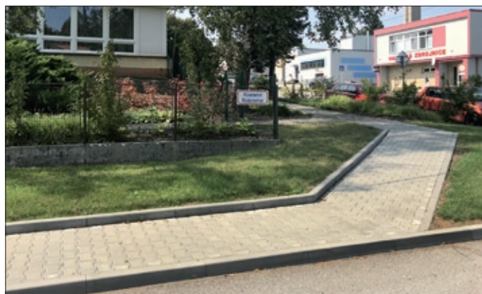
Nový chodník u mateřské školy.