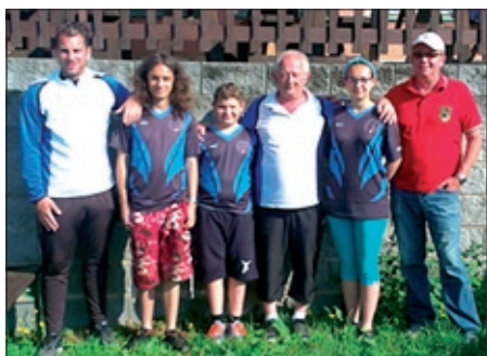
Tým Albrechtic s francouzskými trenéry.

Soustředění se konalo ve dnech 9. 5. – 11. 5. 2018 pod vedením trenérů francouzské reprezentace Francoise Grange, Guy Diniela a Jordaina Carreau, za asistence trenérů české reprezentace a trenérů jednotlivých českých týmů. Proběhly dva dny intenzivního tréninku, který ve své náplni obsahoval veškeré aspekty hry od základů postoje hráčů, přes techniku pohybu až po detailní „práci s koulí“. Všichni junioři i se svými trenéry vstřebávali tyto informace v rámci porovnání s vlastním způsobem hry, který je u nás zažitý. Určitě si z tohoto „přeškolení“ každý vzal pro svou hru mnoho pozitivního.