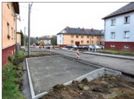
Nové parkovací místa na sídlišti.

V tomto volebním období jsme na rekonstrukci mostu, odkanalizování části Nový Svět, pořízení dvojazyčných tabulí s názvy ulic, pořízení kompostérů, opravy oplocení kolem obou hřbitovů, opravu chodníku před ZŠ a nátěr dřevě-