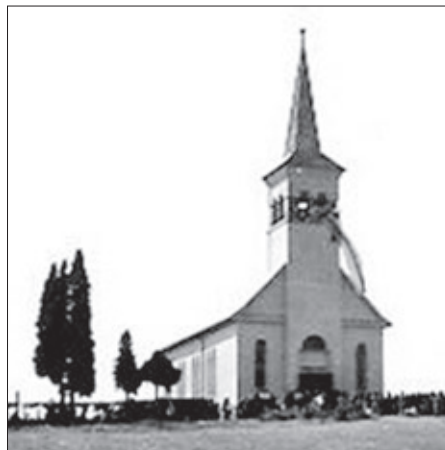
Zřejmě záběr ze slavnosti posvěcení kostela.