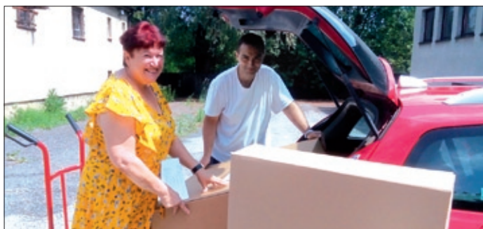
Občané si kompostéry postupně rozvezli do svých zahrádek.