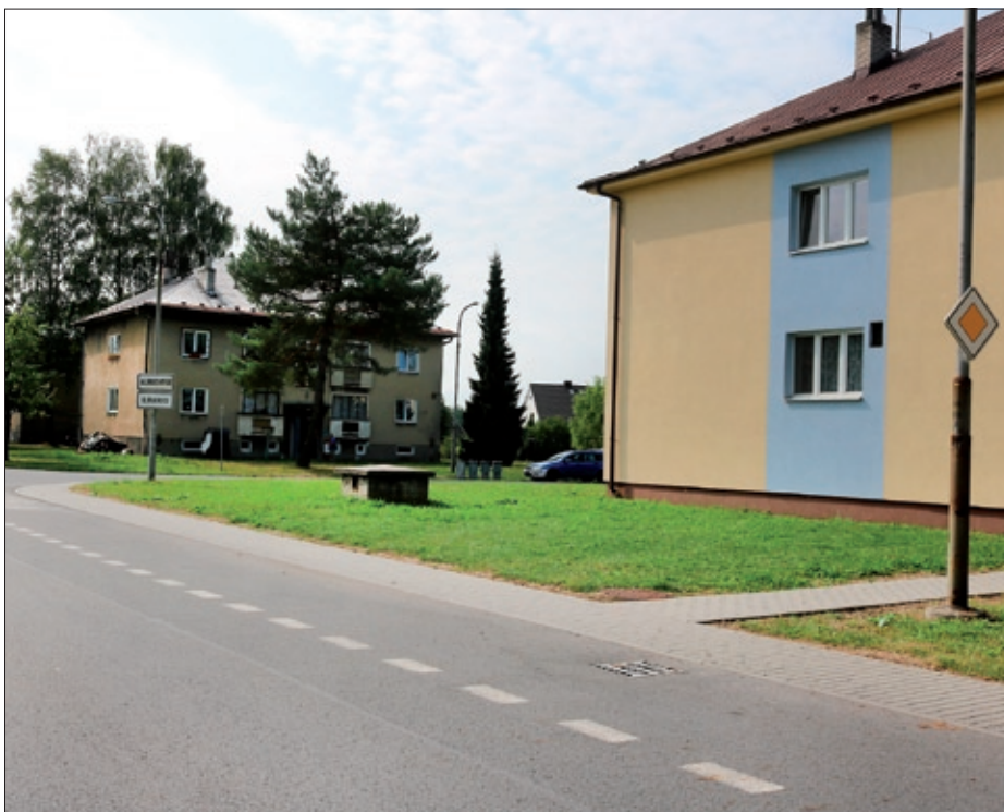
Sídlště Nový svět – obec Stonava po revitalizaci. V pozadí obec Albrechtice, zarostlé chodníky, 20. 8. 2018.

Stalo se pravidlem, že dnešní představitel obce chybí tam, kde se diskutují možnosti získat další peníze pro obec. Přiložené foto je důkazem nečinnosti a zanedbávání obce tak často vytýkaných starostovi na jednáních zastupitelstva. Právem občané ze sousedních obcí se nám posmívají a poukazují na osobu starosty (čerpám informace od občanů a z Facebooku, kde starostovi před nedávnem občané vystavili nelichotivé vysvědčení).