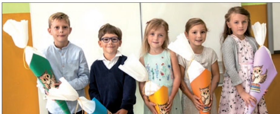
Pierwszy dzień pierwszoklasistów w szkole.