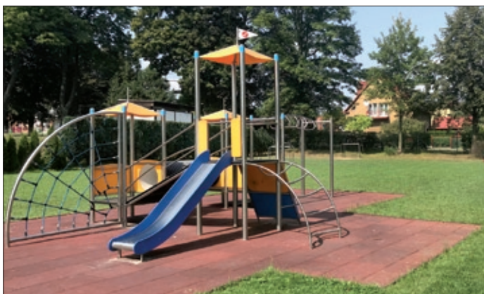
Nové veřejné dětské hřiště Albrechtík.