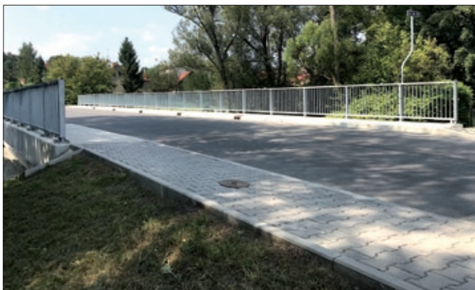
Nový most na ul. Školní.