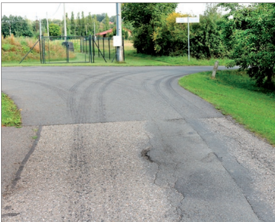
Křižovatka ulic Bělehradská a Lesní – u opravené části komunikace bydlí starosta, 28. 8. 2018.