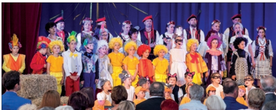
W Domu robotniczym odbyła się akademii z okazji 190-lecia PSP w Olbrachcicach.

Wszyscy wspólnie bawili się do późnych godzin wieczornych, co świadczy o tym, iż szkoła, choć mała, prężnie działa. AM