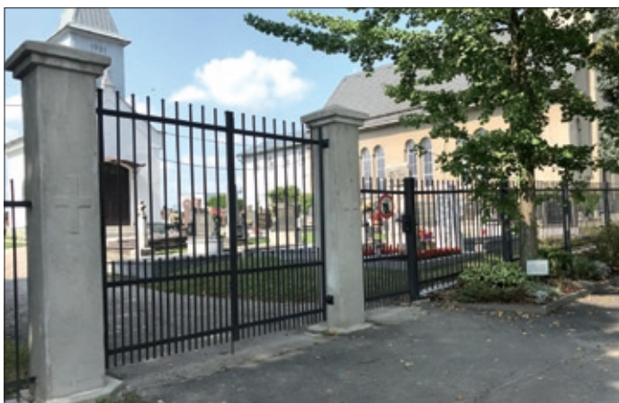
Nové oplocení – evangelický hřbitov.